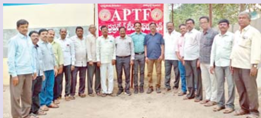
నిరసన తెలుపుతున్న ఏపీటీఎఫ్ నాయకులు