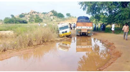
రిలో ఏదో వాహనం ఇరుక్కుపోవడం తో వేరే వాహనం పోవడానికి వీలు లేక నిలిచిపోతున్నాయి. వాటి వల్ల దూర ప్రయాణికులు, ఉద్యోగిస్తులు తమ విధులకు పోవుటకు విసుగెత్తిపోతుందని అంటున్నారు. అక్కడ ఉన్నటువంటి గుంత వూర్చి చదును చేస్తే ప్రయాణాలు సాగుతాయని సంబంధిత అధికారులు చొరవ చూపించాలని ప్రయాణికులతో పాటు వాహనం మండల ప్రజలు కోరుతున్నారు.

నంబులపూలకుంట, మేజర్ న్యూస్ : కదిరి -రాయచోటి ప్రధాన రహదారిపై మండలంలోని ధనియానిచెరువు చెరువు ప్రాంత సమీపంలో ప్రమాదం పొంచి ఉంది. రోడ్డు మరమ్మత్తుల కారణంగా సైట్ రోడ్డు ఏర్పాటు చేయగా.. ప్రతిరోజు సైట్ రోడ్డులో వాహనాలు కూరుకుపోతున్నాయి. వాహన దారులు ఆర్ అండ్ బి అధికారులు చూసి చూడనట్లు వ్యవహరిస్తున్నారు. కదిరి రాయచోటి రోడ్డు పనుల్లో భాగంగా ఈ ప్రాంతంలో గతంలో కల్వర్ట్ నిర్మాణం చేపట్టారు. రహదారి కోసం పక్కనే మరో రహదారి ఏర్పాటు చేసి రాకపోకలు సాగిస్తున్నారు. ఇటీవల కురిసిన వర్షాలకు ఎగువ ప్రాంతం నుంచి నీరు ప్రవహిస్తూ రోడ్డు మీదుగా పోవడంతో వాహనాలు రాకపోకలు సాగడం వాటివల్ల శనివారం సైతం బురద కూరుకుపోయి పెద్ద గుంతల ప్రమాదానికి పొంచి ఉంది వాహనాలు ఇరుక్కుపోయి స్తంభించి పోతున్నాయి. వాహనాలు రాకపోకలకు ఇబ్బంది కలగకుండా ఇప్పటికైనా సంబంధిత అధికారులు మేల్కొని. రాకపోకలకు అంతరాయం కలగకుండా కొద్దిపాటి మరమ్మత్తులు చేయాలని ప్రయాణికులు అంటున్నారు. ప్రతి రోజు నిత్యం ఈ ప్రధాన రహదారి