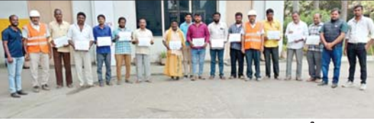
అదానీ సిమెంట్ పరిశ్రమ సర్టిఫికేట్లు అందుకున్న డీలర్లు, కాంట్రాక్టర్లు