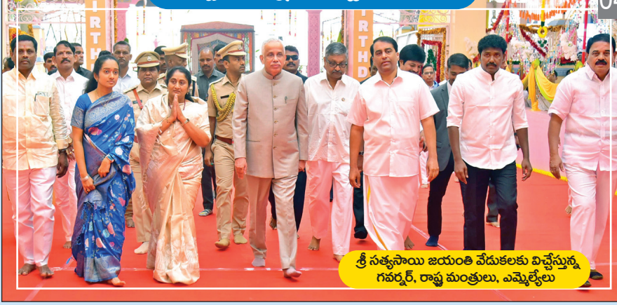
శ్రీ సత్యసాయి జయంతి వేడుకలకు విచ్చేస్తున్న గవర్నర్, రాష్ట్ర మంత్రులు, ఎమ్మెల్యేలు