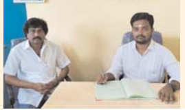
బాధ్యతలు తీసుకుంటున్న ఉండబండ దేవాలయం కార్యనిర్వాహణాధికారి (ఫైల్ ఫోటో)

ఆలయ పాలన కొరవబడిందని, ఇప్పటికైనా ఆలయ కార్యనిర్వాహణ అధికారి రోజువారీ విధులకు హాజరయ్యేలా జిల్లా దేవదాయ శాఖ అధికారులు బాధ్యత వహించాలని భక్తాదులు కోరుతున్నారు. వివరణ : ఉండ బండ వీరభద్ర స్వామి దేవాలయ కార్యనిర్వాహణాధికారి గైర్వాజరు పై జిల్లా దేవదాయ శాఖ సహాయ కమిషనర్ ను వివరణ కోరగా గైర్వాజరు విషయం నా దృష్టికి రాలేదని, విచారించి చర్యలు తీసుకుంటానని తెలిపారు.