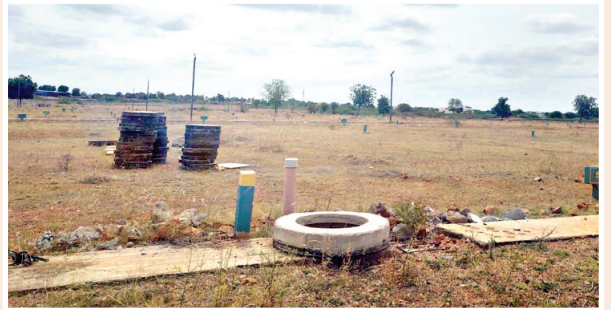
తీసుకోవాల్సిన అధికారులు మొద్దు నిద్ర నటించడం పలు అనుమానాలకు ఊతమిచ్చింది.

జూన్ 28న హా హా హా.. సిటీ పలు బ్యాంకుల్లో మాయా రుణాలు!, జూన్ 25 ఆట కదా కేవలం! జూలై 2న రూ. 100 కోట్ల నల్లధనంపై ఏపీ ఇంటిలిజెన్స్ ఆరా!, జూలై 5న అబ్బుబ్బు పోలీసు బానులు, జూలై 10న అందరూ దొంగలే!, జూలై 27న గో గో.. హా హా.. ఆగస్ట్ 28 అందమైన హార్మోని, హా సిటీలో ఉలిక్కిపడ్డ వైద్యులు అంటూ పలు కథనాలను ఎంతో సాహసోపేతంగా ప్రభుత్వానికి రూ.కోట్లలో జరుగుతున్న నష్టాన్ని, ప్రభుత్వ ఆదాయపన్ను జీవన్మిత శాఖలకు ముసుగేసి సంపాదించుకుంటున్న వక్రమార్గుల అక్రమస్తులను ప్లాట్ నెంబర్లు, విల్లాలతో పాటు నన్నె నంబర్లను బహిష్కరణ చేశాము. అయితే ఎన్ని చేసినా ఎన్ని ఆధారాలతో కథనాలు ప్రచురించిన చర్యలు