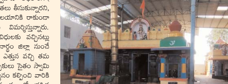
పాల్వూరు ఉండబండ వీరభద్ర స్వామి దేవాలయం