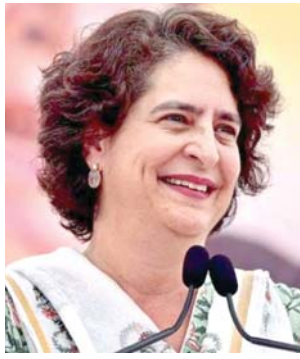
గాంధీలే అని అన్నారు. అదే విధంగా మాజీ ప్రధానమంత్రి ఇందిరాగాంధీ వారసత్వం అయిన రాహుల్ గాంధీ ప్రియాంక గాంధీ సంయుక్తంగా రాబోవు కాలంలో భారత దేశాన్ని సుపరిపాలన అందిస్తారని భారత ప్రజలు ఎదురు చూస్తున్నారని తెలిపారు. ఈ దేశానికి భవిష్యత్తులో దిశ నిర్దేశనం చూపే నాయకులుగా ఎదుగుతున్నారని కొనియాడారు. అంతే కాకుండా ఉక్కు మహిళ ఇందిరాగాంధీ భారత దేశం పరిపాలన ఏ విధంగా అందించారో అంతకన్నా మెరుగైన పాలన సాగిస్తారని ఆశాభావం వ్యక్తం చేశారు.