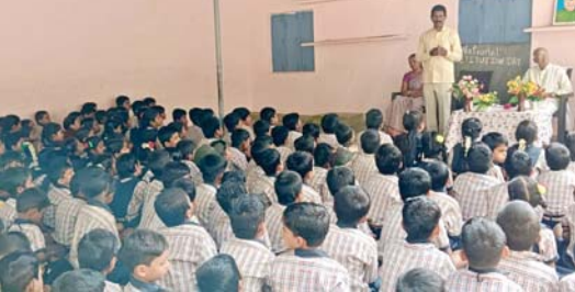
ఒక్కొక్కరికి 400 రూపాయలు ప్రోత్సాహ బహుమతిగా అందజేసి పిల్లలను ఆనందింపజేశారు. అలాగే భారత దేశ అభివృద్ధికి రాజ్యాంగం ఏ విధంగా ఉపయోగపడుతుంది దాని గురించి అంబేద్కర్ దేశానికి చేసిన సేవలను గురించి విద్యార్థులకు తెలియజేశారు ఈ కార్యక్రమంలో శ్రీ షిరిడి సాయి విద్యానికేతన్ పాఠశాల ఉపాధ్యాయులు విద్యార్థులు పాల్గొన్నారు.