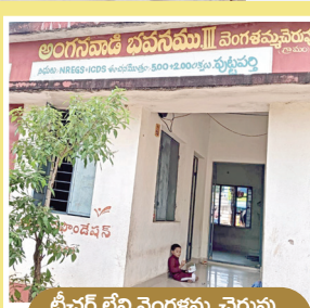
టీచర్ లేని వెంగళమ్మ చెరువు అంగన్వాడి కేంద్రం

గ్రామంలో ఉన్న అంగన్వాడి కేంద్రాన్ని జిల్లా స్థాయి అధికారులు ఒక వ్యక్తి కోసం ఆ కేంద్రం స్థాయిని తగ్గించేవారు. ఆ గ్రామం లో కొనసాగుతున్న అంగన్వాడీ కేంద్రానికి పిల్లలు రావడం తగ్గిపోయారని సాకు చూపి, గ్రామంలో చాలా కుటుంబాలు వక్క గ్రామానికి వలస వెళ్లారనే కారణం చూపుతూ అక్కడ కొనసాగుతున్న