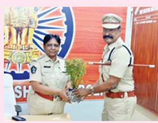
పూర్వకంగా కలిసి పూల మొక్కను అందజేశారు. ఒంగోలు నుండి శ్రీ సత్య సాయి జిల్లాకు బదిలీపై వచ్చారు.