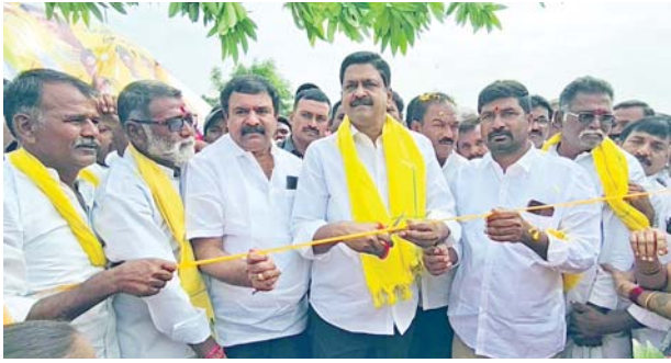
ఎంఎం హజ్ర గ్రామం నుండి జయపురం వరకు తారు రోడ్డు నిర్మాణం ఉరవకొండ నియోజకవర్గం ప్రజలకు అభివృద్ధి పనులు చేయడానికి మొదటి కూలి నెంబర్ వన్ నేనే : రాష్ట్ర ఆర్థికశాఖ, వాణిజ్య, పన్నులశాఖ మంత్రి పర్యాయుల కేశవ్

కూడేరు, మేజర్ న్యూస్ : ఉరవకొండ నియోజకవర్గం కూడేరు మండలం నందు స్థానిక మండల పరిధిలోని ఎంఎం హజ్ర గ్రామం నుండి ఆత్మకూరు మండలం సిద్దిలాపురం గ్రామం వరకు బీటీ రోడ్డు ను శుక్రవారం ప్రారంభించారు. ఈ సందర్భంగా ప్రజలను ఉద్దేశించి మాట్లాడుతూ, హంద్రీనీవా కాలువ వెడల్పు చేసి తీరుతామని, పర్యాయుల కేశవ్ స్పష్టం చేశారు. ఎంఎం హజ్రలో రూ.1.99కోట్లతో రోడ్డు ను నిర్మించి ప్రారంభించామని అన్నారు, నియోజకవర్గంలో ఐదు మండలాల్లో ప్రతి గ్రామానికి రోడ్డు, మౌలిక సదుపాయాలు కల్పనే ధ్యేయంగా పని చేస్తామన్నారు. ప్రతి ఎకరాకు నీరు అందేలా చర్యలు తీసుకుంటామని హామీ ఇచ్చారు. ఉరవకొండ నియోజకవర్గానికి మెదటి కూలిగా పనిచేస్తానని, ప్రజలకు ఇచ్చిన ప్రతి హామీని నెరవేరుస్తానని తెలిపారు. మంత్రిగా ఎక్కువ బాధ్యతలు పెట్టారని, నమయం అంతా విజయవాడ లో ఉన్నప్పటికీ నా గుండె చప్పుడు ఉరవకొండ నియోజకవర్గంలో ఉంటుందన్నారు. మీరిచ్చిన