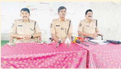
నిర్వహిస్తున్నట్లు పేర్కొన్నారు. ఎలాంటి అవాంఛనీయ ఘటనలు జరగకుండా జాగ్రత్తలు వహిస్తున్నారు.

డి. హీరోహాళి మేజర్ న్యూస్ : అనంతపురం జిల్లా బొమ్మనల్ మండలం నెమకల్లు పంచసీ, కార్యక్రమంలో పాల్గొనడానికి ముఖ్యమంత్రివర్యులు తెదేపా జాతీయ అధ్యక్షులు చంద్రబాబునాయుడు శనివారం వస్తున్న నేపథ్యంలో పోలీస్ పటిష్ట బందోబస్తు నిర్వహిస్తున్నట్లు జిల్లా ఎస్పీ జగదీష్ పి మీడియాకు వెల్లడించారు. ఈ నేపథ్యంలో 500 మంది పోలీసు బందోబస్తును నిర్వహిస్తున్నట్లు తెలిపారు. ఇందులో ఇద్దరు అడిషనల్ ఎస్పీలు, డిఎస్పీలు, సిఐలు, ఎస్ఐలు పోలీసులు బందోబస్తు