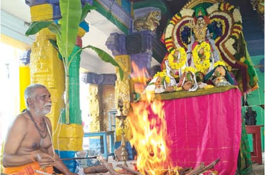
నగరి, మేజర్ న్యూస్: పట్టణంలో వెలసీయన్న కాలభైరవస్వామి క్షేత్రంలో వైభవంగా మహాకాల రక్షక యాగం జరిగినది ప్రతినెల ఆష్టమి సందర్భంగా జరుగు విశేష పూజలో భాగంగా నేడు సంవత్సరంనకు

ఒక పర్యాయం కార్తిక మాసంలో జరుగు అత్యంత విశేషమైన కార్తిక కాలాష్టమి సందర్భంగా మహాకాల రక్షకయాగం విశేషంగా జరిగినది. తిరుపతి శ్రీకాళహస్తి మొదలగు పుణ్యక్షేత్రం నుండి విచ్చేసిన ప్రత్యేక ప్రధాన అర్చకుల ఆధ్వర్యంలో అత్యంత వైభవంగా అలంకరించిన ఉత్సవమూర్తుల ముందు భాగంలో 22కలశములతో ప్రత్యేక పూజలు చేసి సిద్ధంగా ఉన్న మహాయాగగుండంలో మహా యాగ కార్యక్రమాలు నిర్వహించారు. తదుపరి మూలమూర్తికి ప్రత్యేక అభిషేకాలు నిర్వహించి పుష్పమాలల వడమాలలతో అలంకరించి భక్తులకు దర్శన భాగ్యం కలిగించారు. సుమారు 500మంది భక్తులు పాల్గొన్న ఈ కార్యక్రమంలో విభూతి ప్రసాదములతో పాటు సహపంక్తి భోజన కార్యక్రమం ఎటువంటి లోటు లేకుండా ఆలయ నిర్వహకులు నిర్వహించారు. నగరి పరిసర ప్రాంతములోని ఉభయదారులు కాక తిరుత్తని, పొద్దుటూరుపేట, ఆర్కేపేట, తిరుపతి పుత్తూరు, నారాయణసం, మొదలగు పట్టణముల నుండి ఉభయ దారులు, భక్తులు, అధిక సంఖ్యలో పాల్గొన్నారు.