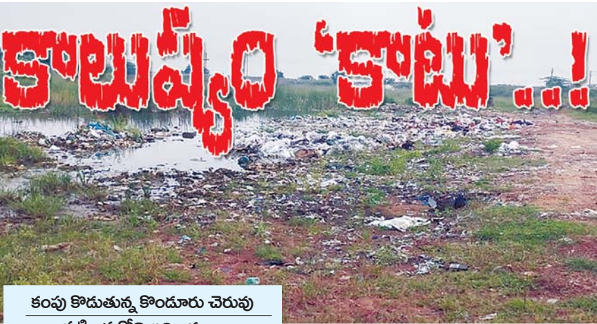
కంపు కొడుతున్న కొండూరు చెరువు పట్టించుకోని అధికారులు ఆక్రమణకు గురవుతున్న జాతీయ రహదారి

తడ, మేజర్ న్యూస్: ఒకప్పుడు స్వచ్ఛమైన నీటితో ప్రకృతికి, పశు పక్షులకు జీవనాధారంగా ఉన్న కొండూరు అక్కంపేట చెరువు కాలుష్యం కోరల్లో చిక్కి కంపు కొడుతున్నాయి. కొండూరు అక్కంపేట గ్రామాల మధ్యలో ఉన్న చెరువు కాలుష్యం కోరల్లో చిక్కుకుని అల్లాడుతున్నాయి. చుట్టూపక్కల పరిశ్రమల నుంచి విడుదలవుతున్న కాలుష్యం, దుమ్ము ధూళి వలన తాగేనీరు నుంచి తినే తిండి, ఇళ్లు, పొలాలు, ఆఖరికి మనుషులు వేసుకున్న దుస్తులతో సహా అన్నీ నల్లగా మారుతున్నాయి. ఈ కాలుష్య ప్రభావంతో అనారోగ్యం బారిన పడుతున్నామని ప్రజలు ఆందోళన వ్యక్తం చేస్తున్నారు. సమస్యని పరిష్కరించాలని అధికారులకు ఎన్నోసార్లు మొర పెట్టుకున్నా పట్టించుకోవడం లేదని వాపోతున్నారు. మండల పరిధిలోని కొండూరు అక్కంపేట గ్రామాల మధ్యలో ఉన్న చెరువు కాలుష్యానికి గురవుతుంది. ప్రభుత్వ అధికారుల నిర్లక్ష్యంతో రోజురోజుకూ చెరువులో ప్లాస్టిక్ కాగితాలు చెత్త పేరుకు పోతుంది. దీంతో చెరువు ఉసికిని కోల్పోయే పరిస్థితి సృష్టంగా కనిపిస్తోంది. మాంబట్టు సెజ్లో ఉండే కంపెనీల నుండి చెత్తను తీసుకుని వచ్చి చెరువులో వేస్తున్నారని