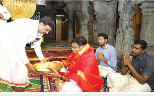
తిరుమల, మేజర్ న్యూస్: తిరుమల శ్రీవారిని చిత్తూరు పార్లమెంట్ సభ్యులు దగ్గుమళ్ల ప్రసాద్ రావు దర్శించుకున్నారు. బుధవారం

ఉదయం విఠపీ విరామ సమయంలో స్వామి వారి సేవలో పాల్గొని మొక్కులు చెల్లించుకున్నారు. దర్శనానంతరం రంగనాయకుల మండపంలో వేదపండితులు వేదాశీర్ష్యచనం అందించగా ఆలయ అధికారులు శ్రీవారి తీర్థప్రసాదాలు అందజేసి పట్టువస్త్రంతో సత్కరించారు. ఆలయం వెలుపల చిత్తూరు పార్లమెంట్ సభ్యులు దగ్గుమళ్ల ప్రసాద్ రావు మీడియాతో మాట్లాడుతూ నూతనంగా ఏర్పడిన పాలకమండలి సభ్యులను అభినందనలు తెలియజేయడానికి వచ్చానని అన్నారు. స్వామి వారి వైభవాన్ని విశ్వవ్యాప్తం చేసేలా పాలకమండలి సభ్యులు కృషి చేయాలని కోరారు. ఎస్సీయే కూటమి అధికారం చేపట్టిన నాటి నుంచి ఏపీలో అభివృద్ధి పరుగులు పెడుతోందన్నారు.