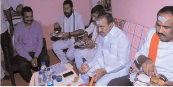
కీసరలోని చినింగని సుదాకర్ నివాసంలో ఆల్పూహారం చేస్తున్న ఈటెల.