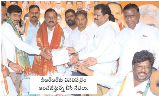
డీఆర్ఆర్ కు విన్తిపత్రం అందజేస్తున్న బీసీ నేతలు.