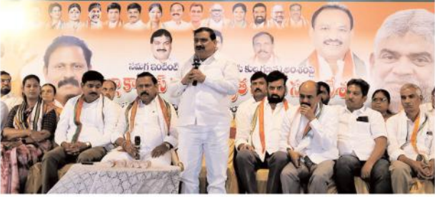
మాట్లాడుతున్న పట్నం మహేందర్ రెడ్డి.

వికారాబాద్, మేజర్ న్యూస్ (నవంబర్ 02): బీసీ కులగణన రాబోయే స్థానిక సంస్థల ఎన్నికల్లో బలహీన వర్గాలకు సరైన ప్రాతినిధ్యం అందించేందుకు దోహదపడుతుందని తెలంగాణ ప్రభుత్వ శాసన మండలి చీఫ్ విప్ డాక్టర్ పట్నం మహేందర్ రెడ్డి తెలిపారు. శనివారం కాంగ్రెస్ పార్టీ జిల్లా కమిటీ అధ్యక్షులలో సత్యభారతి ఫంక్షన్ హాల్ లో నిర్వహించిన జిల్లా స్థాయి బీసీ కుల గణన - సమగ్ర ఇంటింటి కుటుంబ సర్వే పార్టీ విస్తృతస్థాయి అవగాహన కార్యక్రమంలో ఆయన ముఖ్యఅతిథిగా పాల్గొన్నారు. ఈ సందర్భంగా ఆయన మాట్లాడుతూ.... కాంగ్రెస్ పార్టీ ఉదయపూర్ డిక్లరేషన్ తరువాత దేశంలోనే తొలిసారిగా సీఎం రేవంత్ రెడ్డి నేతృత్వంలో సాగుతున్న కులగణన అణగారిన, వెనుకబడ్డ వర్గాల అభివృద్ధికి, రాబోయే రోజుల్లో జరిగే స్థానిక సంస్థల ఎన్నికల్లో బలహీన వర్గాలకు సరైన ప్రాతినిధ్యం అందించేందుకు దోహదపడుతుందన్నారు. గతంలో ఎన్నో రామారావు కాలంలో బీసీలు, బలహీన వర్గాలకు సముచితమైన స్థానం అందించి వారి గౌరవాన్ని పెంపొందించారని ఆయన తెలిపారు.