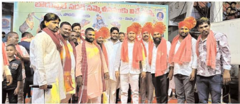
సదర్ వేడుకల్లో పాల్గొన్న యాదవ సోధరులు, ముఖ్య నేతలు

వేడుకల్లో విందులేస్తున్న యాదవ సోధరులు మేడిపల్లి మేజర్ న్యూస్ (నవంబర్ 02) బోడుప్పల్ కార్పొరేషన్ పరిధిలో సదర్ వేడుకలు ఘనంగా జరిగాయి. ఈ మేరకు దీపావళి పండుగ సందర్భంగా బోడుప్పల్ యాదవ సంఘం ఆధ్వర్యంలో సదర్ వేడుకలను నిర్వహించడం