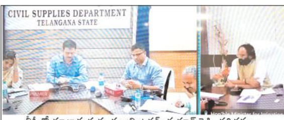
వీసీలో మాట్లాడుతున్న మంత్రి ఉత్తమ్ కుమార్ రెడ్డి, తదితరులు.