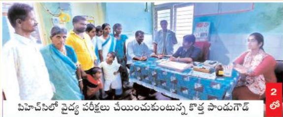
విహార్ లో వైద్య పరీక్షలు చేయించుకుంటున్న కొత్త పాడుగూడ్ 2లో