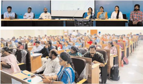
నిర్వహించారు. ఈ కార్యక్రమం ద్వారా ఆరోగ్య శాఖ ప్రాథమిక ఆరోగ్య సేవల్లో సమగ్రతను సామర్థ్యాన్ని పెంచడానికి కృషి చేస్తోంది అని తెలిపారు.