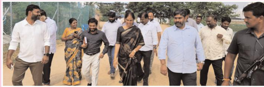
బాలపూర్, మేజర్ న్యూస్ ( నవంబర్ 02): మీరపేట్ మున్సిపల్ కార్పొరేషన్లోని చందన చెరువు, మగతా 2లో