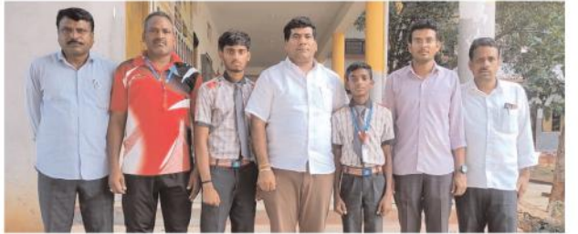
ఖోఖో పోటీలకు ఎంపికైన విద్యార్థులు.