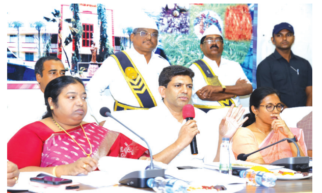
గుంటూరు జిల్లా నేటి దినపత్రిక సూర్య బ్యూరో

‘పత్తి రైతుల సమస్యలు తెలుసుకోగానే మొట్టమొదటగా మేమే స్పందించాం. వేగవంతమైన నిర్ణయాలతో పత్తి కొనుగోలు, సీసీఐ కేంద్రాల ప్రారంభం తదితర నిర్ణయాలు జరిగాయి. ఇంకా ఏదైనా సమస్యలు