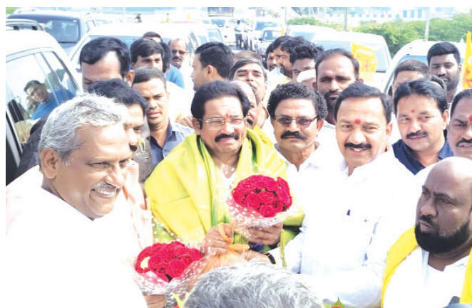
వినుకొండ, మేజర్ న్యూస్

బహిరంగ సభలో పాల్గొన్న చీఫ్ ఐపి జీవీ, ఎంపీ లావు, జూలకంటి, చదలవాడ