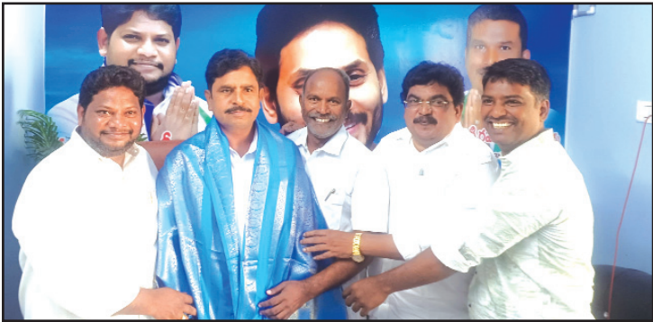
గుంటూరు, మేజర్ న్యూస్ :

- కార్పొరేటర్లు పాపతోటి అంబేద్కర్, దూపాటి వంశీ