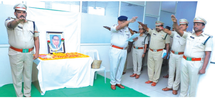
పల్నాడు జిల్లా క్రైం, బ్యూరో, మేజర్ న్యూస్: