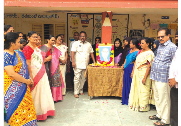
గుంటూరు మేజర్ న్యూస్: