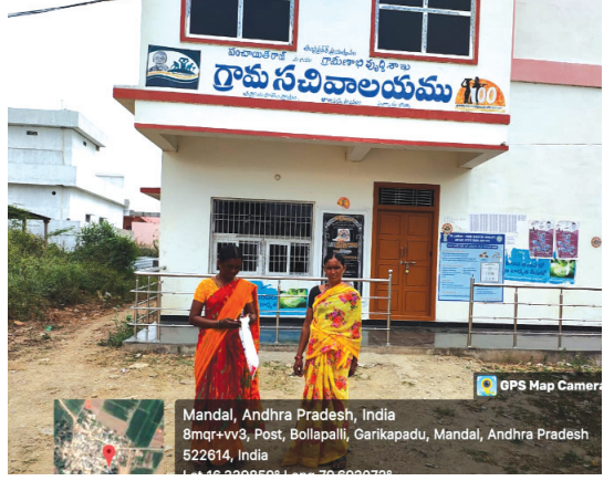
ఎందుకు వాటిని ఉంచలేకపోతున్నారు అని ప్రజలు ప్రశ్నిస్తున్నారు. ఇప్పటికైనా అధికారులు కళ్ళు తెరిచి ఇలాంటి వాటిని నియంత్రించాలని ప్రజలు కోరుతున్నారు.

బొల్లపల్లి, మేజర్ న్యూస్ : బొల్లపల్లి మండలం చక్రాయ పాలెం గ్రామంలో గ్రామ సచివాలయం లో పనిచేసే ప్రభుత్వ ఉద్యోగులు ప్రభుత్వ ఉద్యోగం అంటే విలువ లేకుండా ఉద్యోగస్తులు తన పని తైం లో పనిచేయకుండా కాలాన్ని గడుపుతూ 11 గంటలు అయినా సరే కార్యాలయాలు తెరవకుండా మూసి ఉంచి ప్రజలను ఇబ్బందులకు గురి చేస్తున్నారు మేము ఒక పది నిమిషాలు లేటగా వస్తే మా పనులను పక్కన పెట్టే అధికారులు వాళ్లు ఇంత తైం అయినా కార్యాలయం తెరువకపోతే మాకు ఇబ్బందిగా ఉండదా అని ప్రజలు అడుగుతున్నారు ప్రజలకు మా ప్రాంతం వెనుక బడినటువంటి ప్రాంతంగా ఉన్నప్పటికీ మా ప్రాంతంలోని ప్రజలకు జవాబుదారీతనముగా ఉండవలసిన అధికారులే ఇంత నిర్లక్ష్యంగా ఉంటే మేమేం చేయాలి అంటూ మేము ఫిర్యాదులు చేయడానికి ఆ ఆఫీస్ లో ఎలాంటి ఫిర్యాదు బాక్కులు కానీ ఫిర్యాదు చేయవలసిన వాళ్ళ నెంబర్లు కానీ