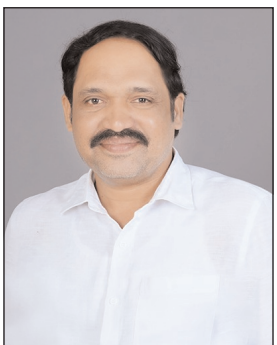
నుంచి విడుదల చేసిన పత్రిక ప్రకటనలో... పశ్చిమగోదావరి జిల్లా, ఉండ్రా