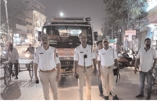
అబిడ్స్ జోన్ ఇన్ఛార్జ్,మేజర్ న్యూస్: ద్విచక్రవాహనాలను డ్రైవింగ్ చేసే వ్యక్తులు