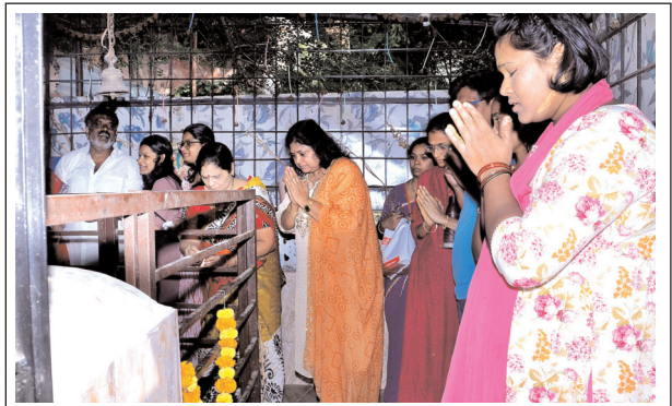
: ఆల్వూల్ లో నాగులచవితి సందర్భంగా భక్తులు అంత్యంత భక్తి శ్రద్ధలతో నాగదేవత ఆలయంలో ప్రత్యేక వూజలు నిర్వహించారు. మంగళవారం ఆలయం లో ఉన్న వట్టలో పాలు పోసి నాగదేవత ను వూజించారు.