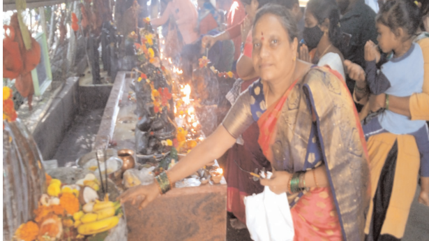
నాగుల చవితి సందర్భంగా క్లాక్ టవర్ వద్ద నాగదేవత గుడి లో మహిళలు పెద్ద సంఖ్యలోపాల్గొని ప్రత్యేక వూజలు నిర్వహించారు. :ముషీరాబాద్ మేజర్ న్యూస్