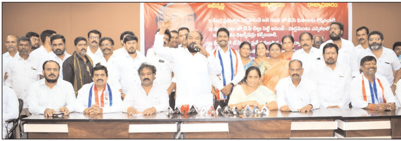
హిమాయత్ నగర్, మేజర్ న్యూస్ : జన గణనలో కులగణన చేపట్టాలని, పార్లమెంట్ లో బి.సి బిల్లు పెట్టి చట్టసభల్లో బి.సిలకు 50 శాతం రిజర్వేషన్లు పెట్టాలని, కేంద్రంలో బీసీలకు ప్రత్యేక మంత్రిత్వ శాఖ, బి.సి ఉద్యోగులకు ప్రమాప్తలో రిజర్వేషన్లు, ప్రైవేటు రంగంలో ఎస్సీ ఎస్టీ బీసీలకు