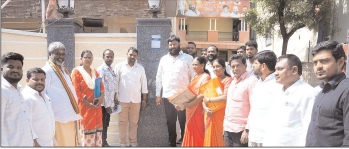
జీడిమెట్ల మేజర్ న్యూస్ : సమగ్ర కుటుంబ సర్వే నిమిత్తం ఇంటింటికి తిరిగి వివరాలు సేకరిస్తున్న సంబంధిత అధికారులకు ప్రజలు తమ వూరి వివరాలను

తెలియజేస్తూ సహకరించాలని మాజీ ఎమ్మెల్యే కూన శ్రీశైలం గౌడ్ అన్నారు. రాష్ట్రంలో సామాజిక, ఆర్థిక, విద్య, ఉపాధి, రాజకీయ కుల సర్వే సమగ్ర ఇంటింటి కుటుంబ సర్వేను ప్రభుత్వం ప్రతిష్టాత్మకంగా చేపట్టిన సంగతి తెలిసింది. ఇందులో భాగంగా గురువారం కుత్బుల్లాపూర్ నియోజకవర్గం పావూర్ నగర్ లోని మాజీ ఎమ్మెల్యే, కాంగ్రెస్ రాష్ట్ర నాయకులు కూన శ్రీశైలం గౌడ్ నివాసంలో ఎన్యూమరేటర్లు గోడకు స్టిక్యర్ ను అతికించారు. ఈ సందర్భంగా కూన శ్రీశైలం గౌడ్ మాట్లాడుతూ రాష్ట్ర ప్రభుత్వం ప్రతిష్టాత్మకంగా కులగణన చేయాలని ఉద్దేశంతో సవంబర్ తేదీలోపు కులగణనను వూరి చేయాలనే సంకల్పంతో ఉండవచ్చు. ఈ సర్వే చేయడానికి ఇంటికి వచ్చిన అధికారులకు కాంగ్రెస్ పార్టీ నాయకులు కార్యకర్తలు అందంగా ఉండి ప్రతి కుటుంబం వద్ద సర్వే