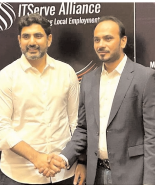
ITServe Alliance Promoting Local Employment