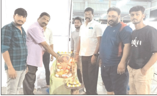
చీరలు, బొజ్జా మెటిరియల్స్ వరంగల్ టవల్స్, లుంగీలు హైదరాబాద్ ఎంబ్రాయిడరీ చీరలు ఈ గద్వాల, చీరల డ్రెస్ మెటిరియల్స్, చీరలు జైపూర్ బెడ్ షీట్స్, టాప్స్, స్కర్టు మధ్యప్రదేశ్ మహేశ్వరి కాటన్ చీరలు, కొండపల్లి బొమ్మలు, ఏటికొప్పాక బొమ్మలు, హైదరాబాద్ మంచి ముత్యాలు, ఖాదీ గ్రామోడ్యోగ్ ఆయుర్వేద ఔషధాలు, హైదరాబాద్ బంజారా ఉత్పత్తులు లెదర్ బ్యాగ్స్, జ్యూట్ బ్యాగులు ఈ ఇమిటేషన్ జ్యూయలరీ, అలంకరణ పుష్పాలు ఈ 1 గ్రా గోల్ అభరణములు, గాజులు మొదలగునవి అందుబాటులో ఉన్నాయన్నారు నగర ప్రజలు సద్వినియోగం చేసుకోవాలన్నారు.