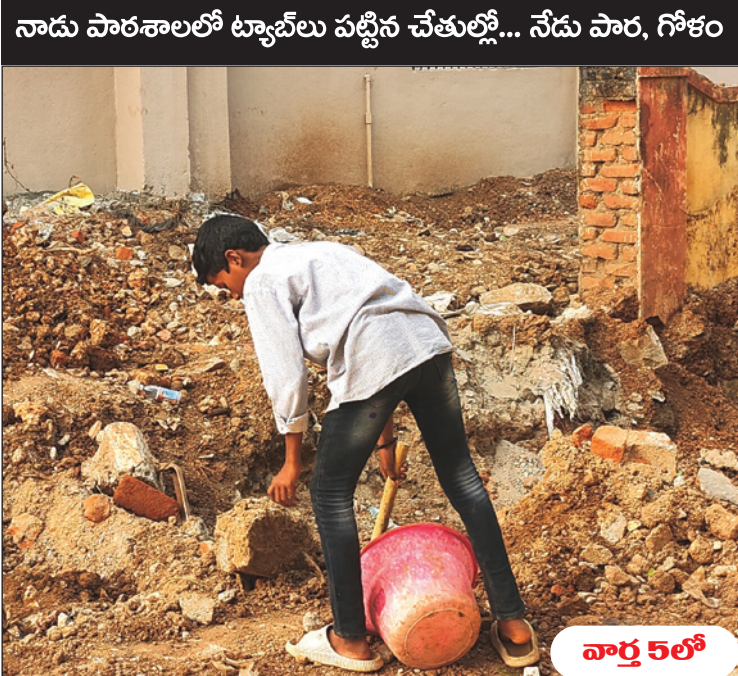
నాడు పాఠశాలలో ట్యూబ్ లు పట్టిన చేతుల్లో... నేడు పాఠ, గోశం