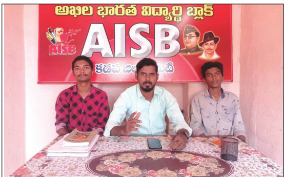
ప్రయత్నించడం దారుణ మన్నారు. పరిసరాలను పరిశుభ్రం గా ఉంచకుండా విషపురుగులు విద్యార్థుల రూముల్లో సంచరిస్తుంటే సిబ్బంది ఏవి చేస్తున్నారని వారు ప్రశ్నించారు.