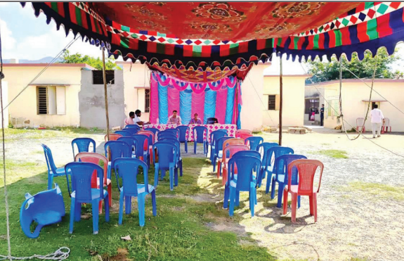
ఖాళీ కుర్చీలతో దర్శిమిస్తున్న గామ రెవెన్యూ సదస్సు

బద్వేల్, మేజర్ న్యూస్. గోపవరం మండలం పి.పి. కుంట సమీపంలో సర్వేసంబర్ 1562 ప్రభుత్వ స్థలంలో దాదాపుగా 15 ఎకరాలలో 600 గుడిసెలు వేసి ఆక్రమించారని గోపవరం ఎమ్మార్వో త్రిభువన్ శుక్రవారం ప్రకటనలో ఈ సందర్భంగా ఆయన మాట్లాడుతూ ప్రభుత్వ స్థలంలో అక్రమంగా గత కొద్దిరోజుల కిందట గుడిసెలు వేశారని. వారిలో స్థానికులుగా ఉన్నవారికి న్యాయం చేయాలని ఉన్నత అధికారుల ఆదేశాల మేరకు గురువారం గుడిసెలు వేసిన వారి వద్దకు వెళ్లి స్థానిక రెవెన్యూ అధికారులు దండోరా ద్వారా శుక్రవారం పిటిగంట ఎంపీపీ సూట్ నందు గ్రామసభ ను నిర్వహిస్తున్నామని గుడిసెలు వేసుకున్న వారిలో స్థానికత కలిగిన వారు వారి సంబంధించిన ఆధారాలు తీసుకొని అర్జీ రూపంలో అధికారులకు ఇవ్వాలని వాటిని పరిశీలించి నిరుపేదలైన వారందరికీ ఇంటి పట్టాలు మంజూరు చేస్తామని దండోరా వేయించామన్నారు. శుక్రవారం పిటి కుంట గ్రామంలోని ఎంపీపీ సూట్ నందు ఉదయం 10 గంటల నుంచి 5 గంటల వరకు గోపవరం మండల తాసిల్దార్ ఆధ్వర్యంలో గ్రామసభ నిర్వహించారు ఈ గ్రామ సభలో ప్రజా ప్రతినిధులు అధ్యక్షులు ఏర్పాటుచేసినప్పటికీ ప్రభుత్వ స్థలంలో ఆక్రమించి గుడిసెలు వేసుకున్న లబ్ధిదారులు గ్రామ సభలో ఉన్న రెవెన్యూ సిబ్బంది కి ఎ ఒక్క లబ్ధిదారులు రాలేదని ప్రభుత్వ స్థలంలో అక్రమంగా గుడిసెలు వేసిన వారిలో స్థానికులు లేకపోవడంతోనే వారు ఈ గ్రామసభను సద్వినియోగం చేసుకోలేదని రెవెన్యూ అధికారి తెలిపారు. ఈ కార్యక్రమంలో గోపవరం మండల సర్వేయర్, రెవెన్యూ సిబ్బంది అదేవిధంగా ప్రజాప్రతినిధులు స్థానికులు పలువురు పాల్గొన్నారు.