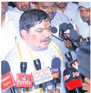
సూర్య కఠింనగర్ ప్రతినిధి

పెరుగుతున్న ధరలకు అనుగుణంగా భారీగా ధరలు పెంచడం జరిగిందని రవాణా, బీసీ సెక్షేమ్ శాఖ మంత్రి పొన్నం ప్రభాకర్ అన్నారు. కఠింనగర్ పట్టణంలోని శర్మనగర్ బీసీ గురుకులలో రవాణా, బీసీ సెక్షేమ్ శాఖ మంత్రి పొన్నం ప్రభాకర్ పర్యటించారు. ప్రభుత్వం డ్రైట్ చార్జీలు, కాస్టాటిక్ చార్జీలు పెంచిన సందర్భంగా విద్యార్థులతో కలిసి దీపావళి వేడుకల్లో పాల్గొన్న మంత్రి పొన్నం ప్రభాకర్. ఈ సందర్భంగా మంత్రి మాట్లాడుతూ గత 10 సంవత్సరాల గా ఓపెన్ మార్కెట్ లో అనేకంగా ధరలు పెరిగినప్పటికీ విద్యార్థుల మెన్ చార్జీలు పెరగలేదు. ముఖ్యమంత్రి, ఉప ముఖ్యమంత్రి, బీసీ సెక్షేమ్ శాఖ మంత్రిగా నేను విద్యార్థి నాయకుడిగా పిల్లలకు మెన్ చార్జీలు, కాస్టాటిక్ చార్జీలు పెంచాలని ముఖ్యమంత్రి, ఉప ముఖ్యమంత్రి దృష్టికి తీసుకుపోవడం జరిగింది. బీసీ, ఎస్సీ, ఎస్టీ, మైనారిటీ వర్గాల తరుపున ముఖ్యమంత్రి, ఉప ముఖ్యమంత్రికి ధన్యవాదాలు తెలిపారు. డ్రైట్ చార్జీలు 3 నుంచి (మిగతా 2లో)