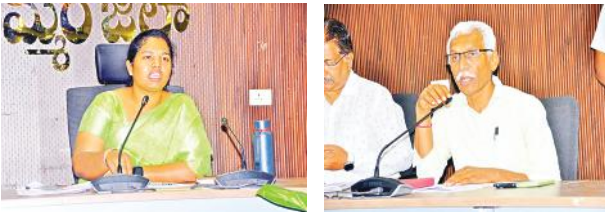
ఖమ్మం (సూర్య బ్యూరో):

-కొనుగోలు కేంద్రాల వద్ద అన్ని వసతులు -ధాన్య కొనుగోలు కేంద్రాల పై మండలాల వారిగా అధికారులతో సమీక్ష చేసిన అదనపు కలెక్టర్లు