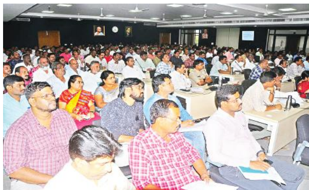
ఖమ్మం (సూర్య బ్యూరో):

-గ్రూప్ 3 పరీక్షల నిర్వహణపై సంబంధిత అధికారులతో సమీక్షించిన అదనపు కలెక్టర్