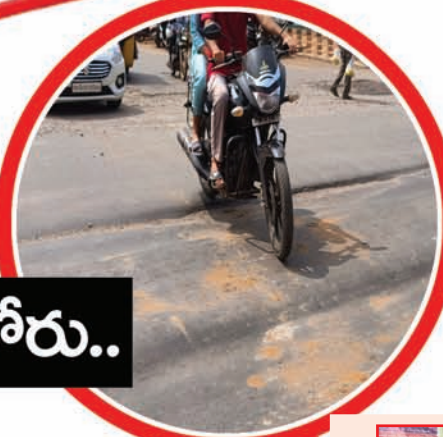
అస్తవ్యస్తంగా మాలిన సత్తుపల్లి మెయిన్ రోడ్డు

సత్తుపల్లి మేజర్ సూర్య సూర్య : తెలంగాణ అభివృద్ధి అంటేనే మొట్ట మొదటగా గుర్తుకు వచ్చేది రోడ్డు, రవాణ. రవాణా సౌకర్యానికి సంబంధించిన రోడ్డు ఎక్కడ లేని విధంగా విశాలంగా గుంతలు లేకుండా ఉంటాయని చుట్టుపక్కల రాష్ట్రాలు కూడా ఈర్ష్య పడే విధంగా ఉంటాయి మన తెలంగాణ రాష్ట్ర రోడ్డు అంతటి గొప్ప పేరు గల తెలంగాణ రాష్ట్రంలో పేరు గొప్ప ఊరు దిబ్బి అన్న విధంగా మాలింది మన సత్తుపల్లి లోని రోడ్ల పరిస్థితి. మన సత్తుపల్లి రొడ్డుపై ప్రయాణమంటేనే వాహనదారులకు నరకాన్ని చూపిస్తుంది ఈ గుంతల రోడ్డు.