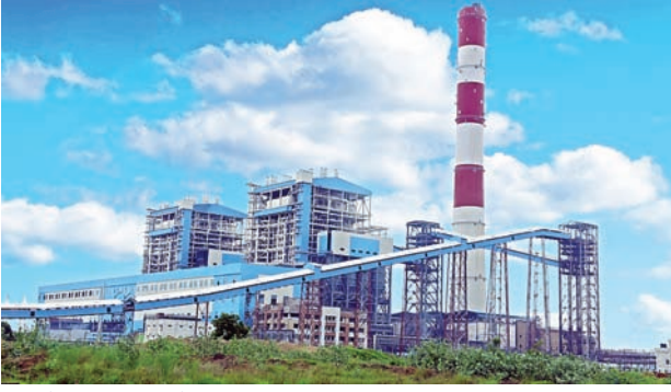
గతేడాదితో పోలితే వెయ్యి కోట్ల కన్నా ఎక్కువ స్థూల లాభం, 36 శాతం వృద్ధి