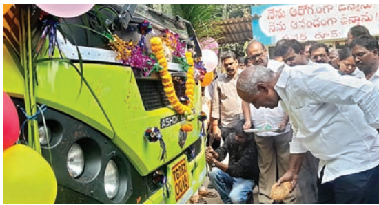
ప్రధాన ప్రాంతాలకు బస్సు సౌకర్యం కల్పించేందుకు కృషి సూతన హంగులతో బస్టాండు నిర్మాణానికి ప్రతిపాదనలు అందించాం