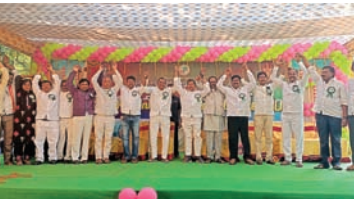
ఇతర కులాలను గౌరవిస్తూ, మున్నూరు కాపు కులస్థులను అభివృద్ధి పరుచుకోవాలి

కార్తీక మాస వనభోజనాల్లో మాజీ మంత్రి వనమా