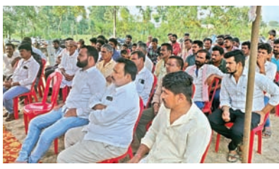
కంటికి రెప్పలా కాపాడుకుంటాం