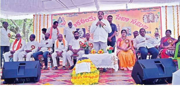
పెనుబల్లి సూర్య మేజర్ స్టూన్...

రాజకీయ జన్మనిచ్చిన సత్తుపల్లి నియోజకవర్గాన్ని తాను మరువనని జిల్లాలో, రాష్ట్రంలో, ఏ నియోజకవర్గంలో తాను ప్రాతినిధ్యం వహిస్తున్న సత్తుపల్లి నియోజకవర్గానికే మొదటి ప్రాధాన్యత అని తన శ్వాస వరకు సత్తుపల్లి నియోజకవర్గ అభివృద్ధికి తాను బద్ధుడనై ఉంటానని సత్తుపల్లి నియోజకవర్గ అభివృద్ధిపై దృష్టి సారినైన వ్యవసాయ శాఖ మంత్రి తుమ్మల నాగేశ్వరరావు అన్నారు. పెనుబల్లి మండలం కారాయి