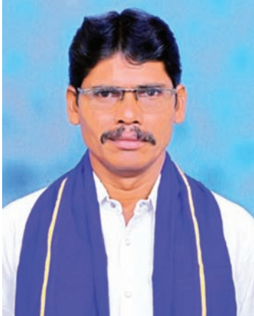
ఉన్న చెరువులు, కుంటలను పరిరక్షించాలని విరస్వామి కోరారు.

ఉదాసీనంగా వ్యవహరిస్తున్నారని, ప్రతి సంవత్సరం చెరువులు ఆక్రమణకు గురై నీరు నిలిచే విస్తరణను కోల్పోతున్నాయని ఆవేదన వ్యక్తం చేశారు. చెరువుల పై ఆధారపడి రైతులు పంటలు సాగు చేసుకుంటున్నారని, చెరువులు కుంటలు కబ్బాకు గురవడంతో ప్రస్తుతం రైతులు అనేక ఇబ్బందులు ఎదుర్కొనవలసి వస్తుందన్నారు. అధికారులు స్పందించి చెరువులకు సర్వే నిర్వహించి హద్దులు నిర్మించాలని, తద్వారా రైతులకు మేలు జరగడమే కాకుండా, భూగర్భ జలాలు అంతరించిపోకుండా కాపాడే అవకాశం ఉంటుందన్నారు. రెవిన్యూ, ఇరిగేషన్ అధికారులు స్పందించి మండల వ్యాప్తంగా