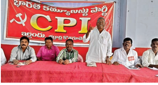
రైతు కార్మిక సంఘాల డిమాండ్