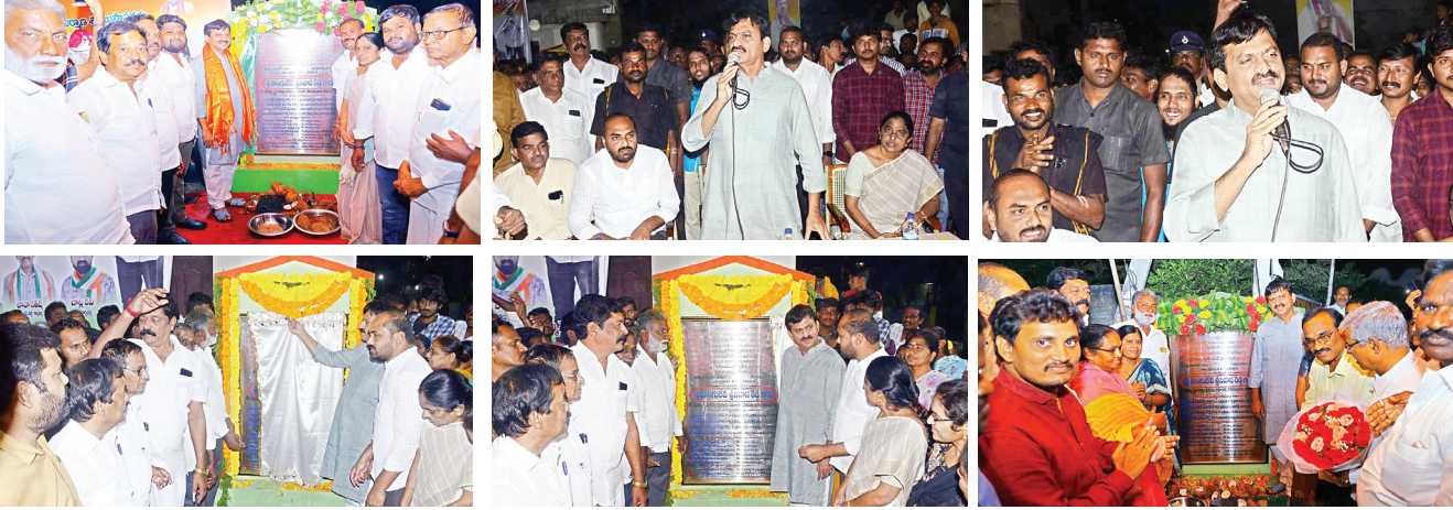
ఖమ్మం (సూర్య బ్యూరో):

-రాష్ట్ర రెవెన్యూ, సమాచార పౌరసంబంధాల, గృహ నిర్మాణ శాఖల మంత్రి వర్యులు పొంగులేటి శ్రీనివాస రెడ్డి -కుటుంబ స్కార్డ్ కార్డు ద్వారానే ప్రభుత్వ పథకాల అమలు -ఖమ్మం రూరల్ మండలంలో పర్యటించి పలు అభివృద్ధి పనులకు శంకుస్థాపనలు చేసిన మంత్రి