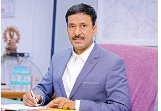
విప్లాట్లు చేయాలని ఆయన ఆర్థిక, సిబ్బంది వ్యవహారాల శాఖ ఉన్నతాధికారులను ఆదేశించారు.

సీఎంఐ ఎన్.బలరామ్ వెల్లిడి కొత్తగూడెం సింగరేణి, సూర్య (మేజర్ న్యూస్) - సింగరేణి సంస్థలో 2023-24 ఆర్థిక సంవత్సరంలో పనిచేసి రిటైర్ అయిన కార్మికులకు పర్సనల్ లింక్ రివార్డు స్కీమ్ (దీపావళి బోనస్) సొమ్మును విడుదల చేస్తున్నామని సింగరేణి సీఎంఐ ఎన్.బలరామ్ శనివారం ఒక ప్రకటనలో పేర్కొన్నారు. ఏప్రిల్ 1, 2024 నుంచి అక్టోబరు 24, 2024 మధ్యలో పనిచేసి రిటైర్ అయిన 2,754 మంది కార్మికులకు దీపావళి బోనస్ కింద ఒక్కొక్కరికి గరిష్టంగా రూ.93,750 ల చొప్పున మొత్తం రూ.18.27 కోట్లను విడుదల చేసినట్లు తెలిపారు. ఈ నెల 27న రిటైర్డ్ కార్మికుల ఖాతాల్లో జమ చేయడానికి తగు