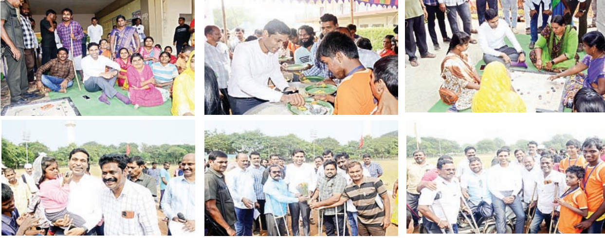
ఖమ్మం (సూర్య బ్యూరో):

-ఏ అంశంలోనూ దివ్యాంగులు నిరుత్సాహ పడవద్దు, -దివ్యాంగుల క్రీడా స్ఫూర్తి అందరికీ ఆదర్శం -దివ్యాంగుల జిల్లా స్థాయి ఆటల పోటీలను ప్రారంభించిన జిల్లా కలెక్టర్