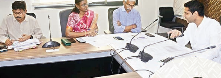
ఖమ్మం (సూర్య బ్యూరో):

-జిల్లా కలెక్టర్ ముజమ్మిల్ ఖాన్, -రైతులకు ధాన్యం సగదు సకాలంలో అందేలా చర్యలు -రాసున్న 3 వారాల పాటు అప్రమత్తంగా ఉంటూ పక్కాగా ధాన్యం కొనుగోలు చేయాలి -ధాన్యం కొనుగోళ్లపై సంబంధిత అధికారులతో సమీక్షించిన జిల్లా కలెక్టర్