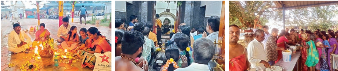
శివాలయానికి పోటెత్తిన భక్తులు..