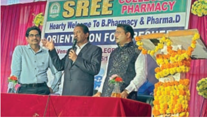
మీ అమూల్యమైన ఫార్మసిస్టు సర్టిఫికేట్ ను వ్యాపారస్తులకు ఇవ్వద్దు