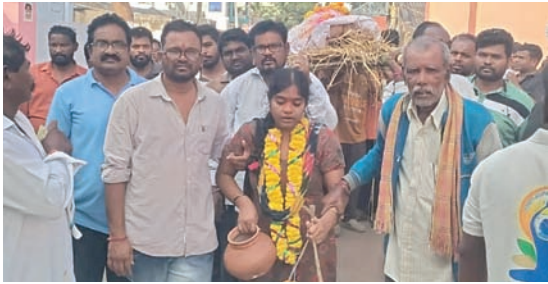
ఘన నివాళి అర్పించిన ఎమ్మెల్యే కూనలేని, జిల్లా