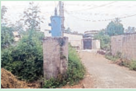
వైరా టౌన్( సూర్య స్వామి):-

మండల పరిధిలోని పాలడుగు గ్రామ పడో వార్డు నందు గల విద్యుత్ నియంత్రికా తక్కువ ఎత్తులో ఉండి చుట్టూ పిచ్చి మొక్కలతో ప్రమాద కరంగా ఉంది. నిత్యం అటువైపు ప్రజలు సంచరిస్తుంటారు. ఎప్పుడు ఎలాంటి ప్రమాదం జరుగుతుందని గ్రామస్తులు భయపడుతున్నారు. విద్యుత్ నియంత్రిక చుట్టూ రక్షణ కంచి ఏర్పాటు చేయాలని వార్డు ప్రజలు కోరుతున్నారు.