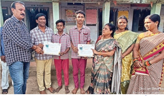
కూలీ లైన్ ఉన్నత పాఠశాలలో చిత్ర లేఖన పోటీలు