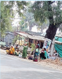
వైరా టౌన్(సూర్య స్వామి):-

బస్ పెల్లర్ లేక ప్రజలు ఇబ్బందులు పడుతున్నారు. మండల పరిధిలోని రెబ్బవరం గ్రామంలో గన్నవరం క్రాస్ రోడ్ వద్ద వాహనాల కోసం చెట్ల కింద నిలబడి గంటల కొద్ది ఎదురు చూస్తుంటారు. శీతాకాలం కావడంతో ఉదయం సాయంత్రం ప్రయాణించేవారు చలికి వణుకుతున్నారు. రోజులు గడుస్తున్న ఆర్టీసీ పట్టించుకోవడం లేదని విమర్శలు వస్తున్నాయి. ఇటీవల గన్నవరం క్రాస్ రోడ్ వద్ద గల బస్ పెల్లర్ ను గుర్తుతెలియని వ్యక్తులు అధికార ప్రయత్నంలో ప్రోక్టెన్ సహాయంతో పడగొట్టిసట్లు సోపల్ మీడియాలో ప్రచారం జరిగింది. ప్రస్తుతం దాన్ని పూర్తిగా తొలగించారు. కొత్తది నిర్మాణం చేస్తారని ప్రచారం జరిగింది కానీ అలా జరగలేదు. రెబ్బవరం నుంచి నెమలి రూట్ లో సమీప గ్రామాల నుంచి ప్రజలు పట్టణాలు వెళ్లేందుకు కొండకొడిమ గన్నవరం ఖానా పురం గ్రామాల నుంచి నుంచి రెబ్బవరం వస్తే అక్కడ నిర్దిష్టించేందుకు ప్రస్తుతం బస్ పెల్లర్ లేదు. నిత్యం ఎంతో మంది విద్యార్థులు వైరా ఖమ్మం పట్టణాల్లోని కళాశాలలకు రాకపోకలు సాగిస్తుంటారు. సామాహిక మరుగుదొడ్లు మూత్రశాలలు లేక మహిళలు తీవ్ర ఇబ్బందులు ఎదుర్కొంటున్నారు. వివిధ గ్రామాల నుంచి వచ్చే వారికి బహిరంగ వినర్షన తప్పడం లేదు. ఇప్పటికైనా ప్రజా ప్రతినిధులు అధికారులు స్పందించి ప్రయాణ ప్రాంగణాన్ని ఏర్పాటు చేయాలని ఆయా గ్రామాల ప్రజలు ముక్తకంఠంతో కోరుతున్నారు.