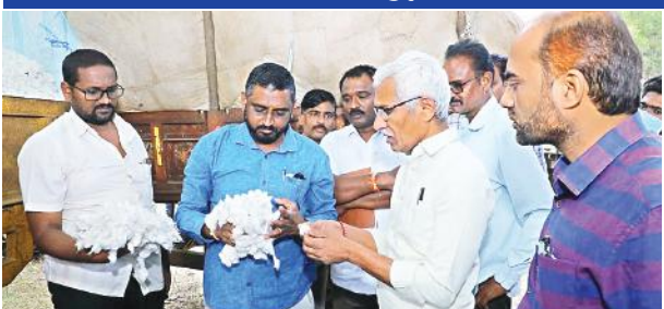
ఖమ్మం (సూర్య బ్యూరో):

-జిల్లాలో పలు జిన్నింగ్ మిల్లును ఆకస్మికంగా తనిఖీ చేసిన అదనపు కలెక్టర్