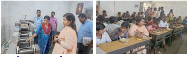
తేమ శాతం రాగానే ధాన్యం కొనుగోలు చేయాలి

ఇందిరా మహిళా శక్తి యూనిట్లు లాభ సాటిగా నడిచేలా చర్యలు