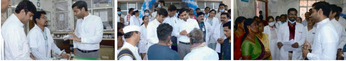
ప్రతి శుక్రవారం ఉదయం 10 గంటల నుంచి 12 గంటల వరకు సీనియర్ సిటిజన్స్ కొరకు ప్రత్యేక క్లినిక్

సీనియర్ సిటిజన్స్ వైద్య సేవల కోసం ప్రత్యేకంగా హెల్థ్ షాపులు సీనియర్ సిటిజన్స్ వైద్య సేవలు విభాగాన్ని వినియోగించుకోవాలి జిల్లా ఆసుపత్రిలో సీనియర్ సిటిజన్స్ వైద్య సేవలను ప్రారంభించిన జిల్లా కలెక్టర్