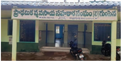
ఉమ్మడి ఖమ్మం జిల్లాలో ఉత్తమ సొసైటీగా గుంపెన..