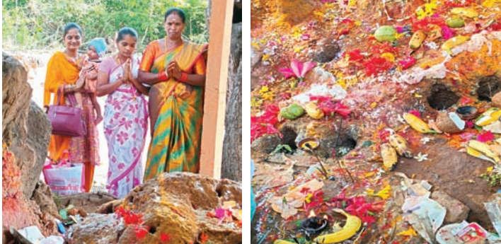
నాగ దేవతలకు ప్రత్యేక పూజలు చేసిన మహిళలు

చండ్రుగొండ, సూర్య (మేజర్ న్యూస్) - నాగుల చవితిని పునస్కరించుకొని చండ్రుగొండ మండల వ్యాప్తంగా నాగుల చవితి వేడుకలు ఘనంగా నిర్వహించారు. మంగళవారం మండల పరిధిలోని మద్దుకూరు గ్రామ శివారు వెంకటేశ్వర స్వామి దేవాలయం ఆవరణలో ఉన్న నాగులపుట్టుకు, మండల కేంద్రంలోని రెవెన్యూ కార్యాలయం ఆవరణలో ఉన్న పుట్టలో నాగదేవతలకు మహిళలు గుడ్లు, పాలు, పోసి ప్రత్యేక పూజలు చేశారు. నాగులచవితి అంటే నాగదేవతలకు ఆరాధించే పండుగ కార్తీక మాసంలో దీపావళి అమావాస్య తర్వాత నాలుగవ రోజు అంటే చత్తుర్తి నాడు నాగుల చవితి పండుగను జరుపుకుంటారు.. నాగదేవతలకు పూజలు చేయడం ద్వారా దోషాలు తొలగి అంతా మంచే జరుగుతుందని భక్తుల విశ్వాసం.