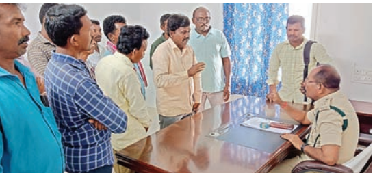
రేంజీ కార్యాలయం ఎదురుగా పోడు వ్యవసాయదారులు నిరసన