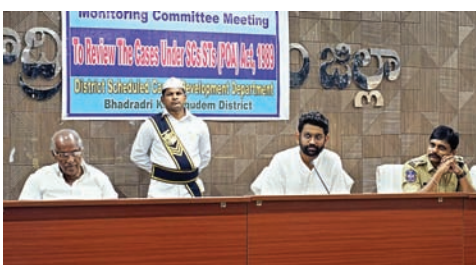
జిల్లా కలెక్టర్ జితేష్ వి.పాటిల్