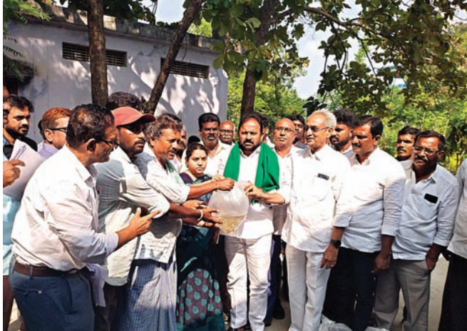
చేప పిల్లలు పంపిణీలో ఎమ్మెల్యే రాందాస్ నాయక్ మత్స్యకారులకు 45750 చేప పిల్లలు పంపిణీ

జూలూరుపాడు, సూర్య(మేజర్ న్యూస్) - తెలంగాణ రాష్ట్ర ప్రభుత్వం మత్స్యకారులను అన్ని విధాల ఆదుకుంటుందని వైరా నియోజకవర్గ ఎమ్మెల్యే మాలోత్ రాందాస్ నాయక్ అన్నారు. గురువారం మండల పరిషత్ కార్యాలయం ప్రాంగణంలో జిల్లా మత్స్య శాఖ ఆధ్వర్యంలో మండలానికి చెందిన మత్స్యకారులకు చేప పిల్లల పంపిణీ కార్యక్రమాన్ని ప్రారంభించారు. మండల పరిధిలోని ఏడు చెరువులకు సుమారు 45750 చేప పిల్లలను పంపిణీ చేయడం జరిగిందని ఎమ్మెల్యే తెలిపారు. లబ్ధిదారులైన మత్స్యకారులు చేప పిల్లలను జాగ్రత్తగా పోషించాలని, తద్వారా మత్స్యకారుల అభ్యున్నతి సాధించాలన్న రాష్ట్ర ప్రభుత్వం ఆకాంక్షను అందుకోవాలని అన్నారు. రాష్ట్ర ప్రజల సంక్షేమాన్ని దృష్టిలో ఉంచుకొని తెలంగాణ రాష్ట్ర ప్రభుత్వముఖ్యమంత్రి రేవంత్ రెడ్డి ప్రజా ఆమోదయోగ్యకరమైన పథకాలను ప్రవేశపెట్టారని, సంక్షేమ ఫలాలు ప్రతి ఇంటికి అందుతున్నాయని తెలిపారు. ఈ కార్యక్రమంలో జిల్లా మత్స్య శాఖ ఏడీ ఇంతియాజ్ అహ్మద్ ఖాన్, ఎంపీడీవో కరుణాకర్ రెడ్డి, తహశీల్దార్ స్వాతి బిందు, సూపర్వైజర్ తాళ్లూరి రవి, ఆర్ఐఐ తిరుపతి రావు, ఎంపిఓ