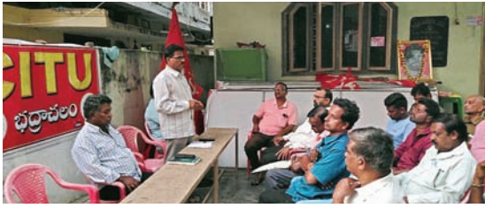
భద్రాచలం పట్టణ ప్రజల అవసరాల నిమిత్తం ఇసుక ర్యాంపుని ప్రారంభించాలి