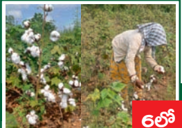
శీతలో తీసుకోవాల్సిన మెళకువలు