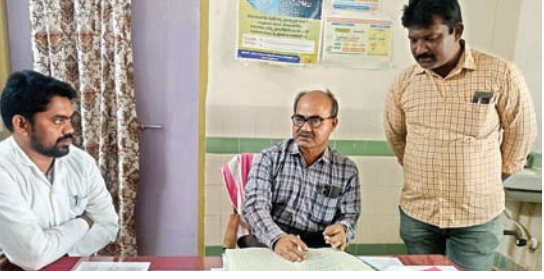
సిబ్బంది విధులకు సకాలంలో హాజరుకావాలని సూచన రోగుల పట్ల సిబ్బంది మర్యాదపూర్వకంగా నడచుకోవాలని హితవు