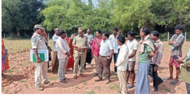
పోడు సాగు రైతుల సమస్య పరిష్కారానికి కృషి చేస్తా..