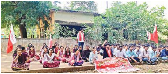
విద్యారంగ సమస్యలపై ముఖ్యమంత్రి సమీక్ష నిర్వహించాలి