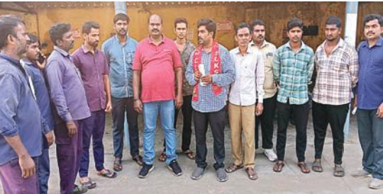
ముఖ్యమంత్రి రేవంత్ రెడ్డి స్పందించాలి.

కాంట్రాక్టు కార్మికుల న్యాయమైన డిమాండ్ లు పరిష్కరించాలి.