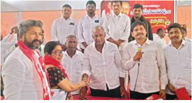
త్యాగాలతో నిర్మితమైన సిపిఐకి ఎదురు లేదు

కమ్యూనిస్టు పార్టీ కార్యకర్తలు ప్రజల్లో మమేకమై సేవలందించాలి