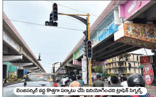
బెంజన్ రోడ్ వద్ద కొత్తగా ఏర్పాటు చేసిన వినియోగించని ట్రాఫిక్ సిగ్నల్స్

ఏ సిగ్నల్ చూసినా, ముఖ్యమైన రోడ్ల అన్ని చోట్లా ఎప్పటినుంచో విజయవాడ పోలీసుల సీసీ కెమెరాలను ఏర్పాటు చేయబడి ఉన్నాయి. వాటిని నిరంతరం పర్యవేక్షించేందుకు కమాండ్ కంట్రోల్ ను కూడా పోలీసులు ఏర్పాటు చేశారు. అయితే ఈ సీసీ కెమెరాలు అన్ని చోట్ల పని చేయడం లేదని, కొన్ని చోట్ల లైమ్ ఫీడ్ కూడా ఉందని, ఆ కారణంతోనే సిబ్బంది దొంగలను పట్టుకోవడంలో విఫలమవుతున్నారని వాహన యజమానులు అసహనంతో చెబుతున్నారు. టెక్నాలజీని మన పోలీసులు అందరి కంటే మెరుగ్గా వినియోగిస్తూ నేరాలను అదుపు చేసేందుకు సర్వసన్నద్ధంగా ఉన్నా కూడా ఆ టెక్నాలజీ ఉపయోగించిన మేర వారికి ఉపయోగపడటం లేదని, సీసీ కెమెరాలు అలంకారానికే ఉన్నట్లుగా