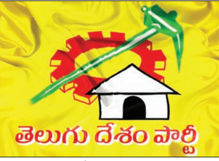
తెలుగు దేశం పార్టీ

విజయవాడ, మేజర్ స్టాఫ్: రాష్ట్రంలో కూటమి ప్రభుత్వం అధికారంలోకి వచ్చి దాదాపు ఆరు నెలలు అవుతోంది. అధికారంలోకి వచ్చిన వెంటనే కార్యకర్తల మనోభావాల ప్రకారం పాలన ఉంటుందని, ఆ పార్టీ కార్యకర్తలు, సానుభూతిపరులు ఆశించారు. తాము ప్రతిపక్షంలో ఉన్నప్పుడు తమను, తమ అధినేతను వేధించిన వారిపై కూటమి ప్రభుత్వం తీవ్ర చర్యలు తీసు కుంటుందని వారు భావించారు. అయితే ప్రభుత్వాధినేత చంద్రబాబు మాత్రం కక్షపూరిత రాజకీయాల చేయనంటూ పాలనపై దృష్టిసారించారు. దీంతో.. టీడీపీ కార్య కర్తలు, నాయకులు, సానుభూతిపరులు టీడీపీ అధినేతపై తీవ్రస్థాయిలో ఆసంతృప్తి వ్యక్తం చేశారు. తాము అధికారంలో ఉన్నా..ఇంకా వైకా పా నాయకులు, వారి సానుభూతి పరులే పెత్తనం చేస్తున్నారని, ప్రభుత్వ కార్యాలయాల్లో కూడా వారిదే హవా నడుస్తోందంటూ నిరసన స్వరాలను వినిపించారు. అయితే చంద్రబాబు వారిని పట్టించుకోకుండా తన మానాన తాను పనిచేసుకుంటూ వెళ్ళారు. దీంతో వైకాపా కార్యకర్తలు, ఆ పార్టీకి చెందిన సోషల్మీడియా కార్యకర్తలు కూటమి ప్రభుత్వంపై విషం చిమ్మడం మొదలుపెట్టారు. అంతటితో ఆగకుండా డిప్యూటీ చీఫ్ మినిస్టర్, పంచాయితీరాజ్ మంత్రి పవన్కళ్యాణ్ను ఆయన కుటుంబ సభ్యులను లక్ష్యంగా చేసుకుని బూతులు తిట్టడంతో.. హోంమంత్రి అనిత శాంతి భద్రతల విషయంలోనూ, సోషల్ మీడియాలో బూతులు తిట్టేవారిని కట్టిడి చేయలేదంటూ పవన్ ఆగ్రహం వ్యక్తం చేశారు. దీంతో ప్రభుత్వ పెద్దల్లో ఒక్కసారిగా కదలిక వచ్చింది. సోషల్ మీడియాలో ఆసంభ్య పోస్టులు పెట్టిన వారిపై కేసులు నమోదుచేయాలని, గతంలో.. చంద్రబాబు, పవన్కళ్యాణ్, లోకేష్లను దూషించిన వారిపై కూడా కేసులు పెట్టాలని పోలీసులకు ఆదేశాలు ఇచ్చారు.