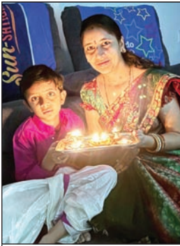
అమెరికా డల్లస్ లో ఎస్.ఎస్.ఆర్. కుమార్తె అంపేరాయని కనక దుర్గ, మనవడు చి.జై ధన్వన్