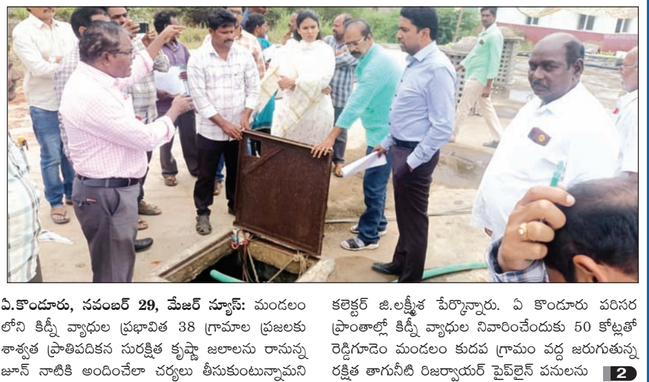
ఏ.కొండూరు, నవంబర్ 29, మేజర్ స్టూన్స్: మండలం లోని కిడ్నీ వ్యాధుల ప్రభావిత 38 గ్రామాల ప్రజలకు శాశ్వత ప్రాతిపదికన సురక్షిత కృష్ణా జలాలను రానున్న జూన్ నాటికి అందించేలా చర్యలు తీసుకుంటున్నామని