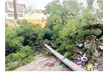
చెట్టు విరిగి గోడపై పడిన దృశ్యం.