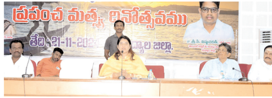
ప్రపంచ మత్స్యశాఖ సమావేశంలో మాట్లాడుతున్న కలెక్టర్ రాజకుమారి

అభివృద్ధికి కృషి చేస్తామన్నారు. దేశ ఆర్థికంగా అభివృద్ధి చెందాలంటే మత్స్యశాఖ ప్రాముఖ్యత అధికంగా ఉందని రాష్ట్రంలో మన జిల్లా 12వ స్థానంలో ఉందన్నారు. రాయలసీమ ప్రాంతంలో రాయలసీమ ప్రాంతంలో ఆహారపు అలవాట్లలో చికెన్, మత్స్యకార సంఘ నాయకులు చర్యలు తీసుకోవాలన్నారు. ప్రస్తుతం జిల్లాలో 45వేల హెక్టార్లలో