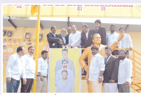
పాలాభిషేకం నిర్వహిస్తున్న దృశ్యం

కర్నూలు, మేజర్ న్యూస్ ప్రతినిధి: కర్నూలు హైకోర్టు బెంచ్ ఏర్పాటుకు ఆమోదం తెలిపిన సీఎం చంద్రబాబునాయుడుకు టీడీపీ జిల్లా న్యాయవాదులు ధన్యవాదాలు తెలిపారు. గురువారం జిల్లా టీడీపీ కార్యాలయం ఎదుట సీఎం చంద్రబాబు చిత్రపటానికి పాలాభిషేకం నిర్వహించారు. ఈ సందర్భంగా