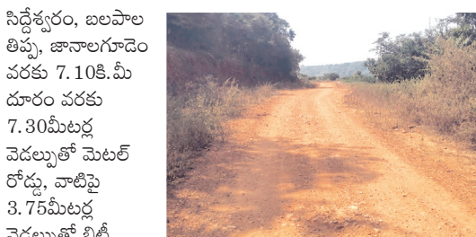
ఎంపీ బైరెడ్డి చొరవతో జానాలగూడెంలోని తారురోడ్డుగా మారబోతున్న మట్టిరోడ్డు

నంద్యాల కల్చరల్, మేజర్ న్యూస్ : శ్రీశైలం జలవిద్యుత్ ప్రాజెక్టు నిర్మాణం కోసం విలువైన, సారవంతమైన వ్యవసాయ భూములు, ఇల్లు త్యాగం చేసి సర్వం కోల్పోయి నల్లమల అరణ్యంలో కనీస వసతులకు దూరంగా జీవిస్తున్న అడవి బిడ్డలకు కనీసం రోడ్డు మార్గం ఏర్పాటు చేసి రాష్ట్రానికి విద్యుత్ వెలుగులు ప్రసరింప చేసి చీకట్లో మగ్గుతున్న ఆ గ్రామాలకు బయటి ప్రపంచంలో అనుసంధానం చేసేందుకు విద్యుత్ సరఫరా కోసం నంద్యాల ఎంపీ బైరెడ్డి శబరి శ్రమిస్తున్నాడు. నంద్యాల జిల్లా కొత్తపల్లి మండలం నల్లమల అరణ్యంలో బయటి ప్రపంచానికి దూరంగా బతుకుతున్న బలపాల తిప్ప, జానాలచెంచుగూడెం, సిద్దిశ్వరం, కపిలేశ్వరం గ్రామాల్లో విద్యుత్ సరఫరాకు రూ.50లక్షలు, తారు రోడ్డు నిర్మాణం కోసం రూ.4.40కోట్లు కేంద్ర ప్రభుత్వం ద్వారా ఎంపీ డాక్టర్ బైరెడ్డి శబరి నిధులు మంజూరు చేయించారు. కపిలేశ్వరం గ్రామం నుంచి