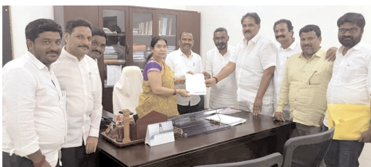
సీనిల్ జడ్జికి వినతిపత్రం అందజేస్తున్న ఎమ్మెల్యే