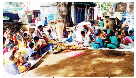
భూమి పూజ చేస్తున్న గ్రామస్తులు