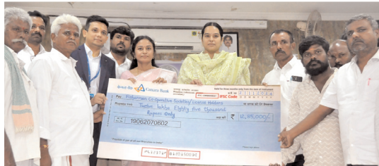
చెక్కులను అందజేస్తున్న దృశ్యం