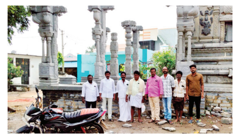
భూమి పూజ చేస్తున్న గ్రామస్తులు (ఫ్రైట్ ఫోటో)