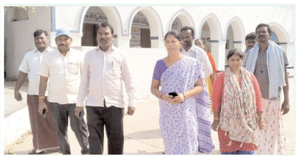
పర్యటిస్తున్న ఎంపీ డివో