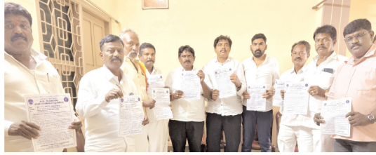
వార్ పోస్టర్లను విడుదల చేయాలి