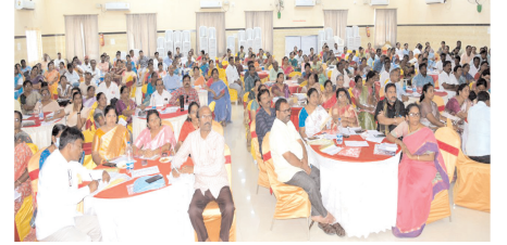
హాజరైన సిబ్బంది, అధికారులు

క్షేత్రస్థాయి సిబ్బందికి సంపూర్ణ శిక్షణ ఇచ్చి గ్రామస్థాయిలో విస్తృతంగా తీసుకుని వెళ్లేందుకు కృషి చేయాలని కలెక్టర్ తెలిపారు. అనంతరం కిశోర బాలల పరిరక్షణపై ముద్రించిన పుస్తకాన్ని, గోడపత్రికలను కలెక్టర్ అవిష్కరించారు.