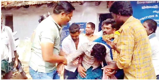
అన్యాయం గురి అయిన వ్యక్తిని వైద్యశాలకు తరలింపు దృశ్యం