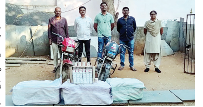
పట్టుబడ్డ మద్యంలో అధికారులు

లోకి తీసుకున్నారు. ఏపి 21ఎఫ్ 0417, ఏపి 09కె 8117 నెంబరు గల బైకులను సీజ్ చేశారు. మద్యం విలువ దాదాపు రూ. 57, 600ఎస్బి ఇస్తాయి