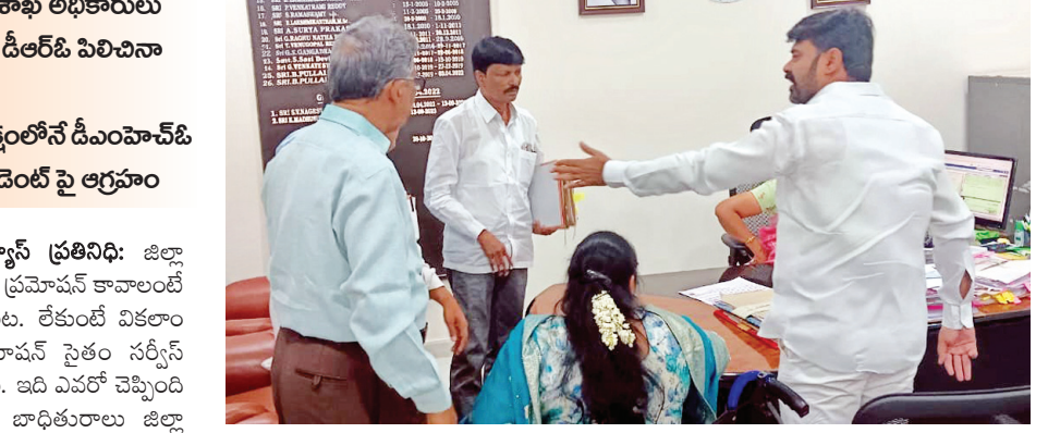
వాగ్వివాదానికి దిగిన పార్వతిభాయి, దళిత సంఘం నాయకుడు మిగతా 2లో