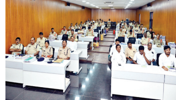
సమావేశానికి హాజరైన డిఎస్పీలు, సిఐలు, ఎస్సీలు అధికారులను, సిబ్బందిని జిల్లా ఎస్పీ ఆభివందించారు.

పెండింగ్ ట్రయల్ కేసులలో అసిస్టెంట్ పబ్లిక్ ప్రాసిక్యూటర్ తో మాట్లాడి ముద్దాయిలకు శిక్షలు వదల విధంగా చర్యలు తీసుకోవాలన్నారు. లోక్ అదాలత్ లో కాంపౌండ్ మెంట్ కేసులు తగ్గించాలన్నారు. రోడ్డు ప్రమాదాలు జరగకుండా సంబంధిత శాఖల సమన్వయంతో చర్యలు తీసుకోవాలన్నారు. రోడ్డు ప్రమాదాలలో బాధితులకు తగిన నష్టపరిహారం వచ్చే విధంగా చర్యలు తీసుకోవాలన్నారు. ఈ - చాలన్ లు రికవరీ చేయాలన్నారు. సైబర్ చీటింగ్ కేసుల్లో బాధితులు మోసపోయిన సమస్యలను బ్యాంకులలో ఫ్రీజ్ చేయించిన ఆ మొత్తాన్ని కోర్టు అనుమతితో బాధితులకు అందజేయాలన్నారు. ఎవరైనా సైబర్ నేరాల బారిన పడితే 1930కి వెంటనే ఫిర్యాదు చేసే విధంగా ప్రజలకు అవగాహన చేయాలన్నారు. వెంటనే ఫిర్యాదు చేస్తే నష్ట శాతాన్ని తగ్గించవచ్చున్నారు. విజయలక్ష్మి పోలీసింగ్ కు ప్రాధాన్యత ఇవ్వాలన్నారు. నేర నివారణకు కృషి చేయాలన్నారు.