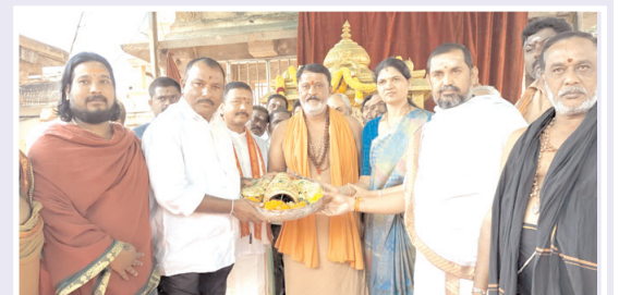
బంగారు పూత కిరీటాన్ని అందజేస్తున్న ఎమ్మెల్యే, దాతలు

మహానంది, మేజర్ న్యూస్ : మహానంది పుణ్య క్షేత్రంలో వెలసిన శ్రీ కామేశ్వరి అమ్మవారికి బంగారు పూతతో తయారు చేసిన కిరీటాన్ని బహూకరించారు.