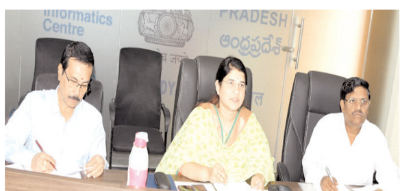
రోడ్ల నిర్మాణ పనుల ప్రగతిపై పంచాయతీరాజ్ అధికారులతో సమీక్షిస్తున్న కలెక్టర్

పూర్తి చేయాలని కలెక్టర్ ఆదేశించారు. ఆళ్ళగడ్డ నియోజకవర్గంలో 240రోడ్లకు గాను 41 పూర్తయ్యాయని నిర్మాణంలో ఉన్న 199 రోడ్లను డిసెంబర్ చివరి