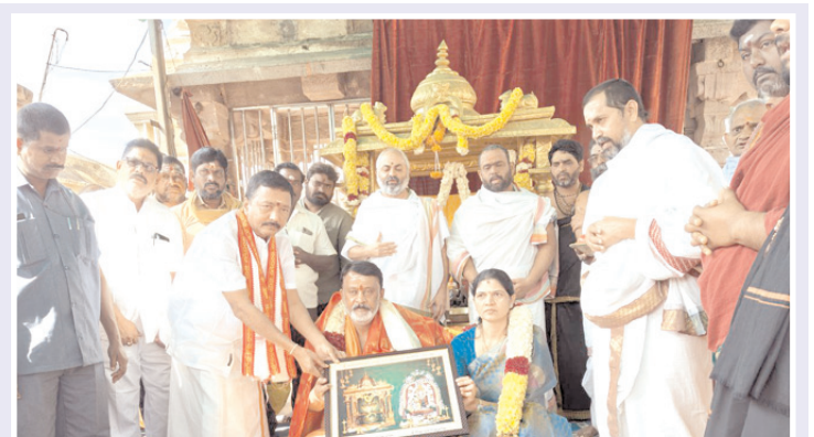
మహానంది క్షేత్రంలో ఎమ్మెల్యేకు జ్ఞాపికను అందజేస్తున్న దృశ్యం