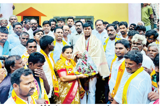
టిడిపిలోకి ఆహ్వానిస్తున్న ఎమ్మెల్యే జీవీ

పార్టీ కందువా వేసి ఆహ్వానించిన ఎమ్మెల్యే జీవీ