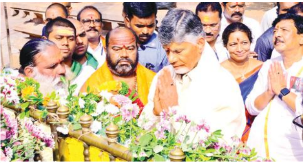
ఆలయ ద్వజస్తంభానికి నమస్కరించుకుంటున్న సీఎం

శ్రీశైలం, మేజర్ న్యూస్: ద్వాదశశతాబ్దం రెండవ జ్యోతిర్లింగం, ఆరవ అష్టాదశ శక్తిపీఠం... ఇలలో వెలసిన కైలాసంగా ప్రసిద్ధి చెందిన శ్రీశైలంలోని శ్రీ భ్రమరాంబ మల్లికార్జున స్వామివార్లను రాష్ట్ర ముఖ్యమంత్రి నారా చంద్రబాబు నాయుడు దర్శించుకుని ప్రత్యేక పూజలు నిర్వహించుకున్నారు. ఆలయ మిగతా 2లో