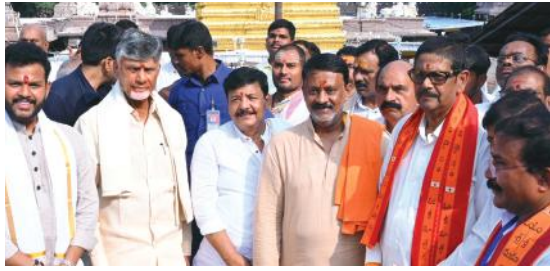
ఆలయ ప్రాంగణంలో సీఎంతో మంత్రులు, ఎమ్మెల్యేలు