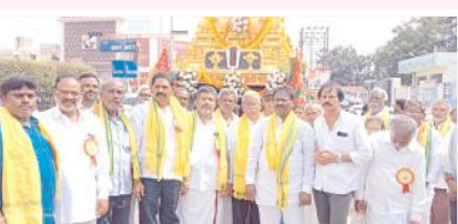
పాదయాత్రగా వెళ్తున్న దృశ్యం