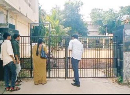
గేట్లు మూసి విచారణ చేస్తున్న పోలీసులు ,