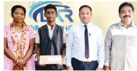
జాతీయ విద్యా దినోత్సవ వ్యాసరచన పోటీలలో పాల్గొన్న విద్యార్థులు.

రూ.5వేలనగదు పురస్కారం అందించిన జిల్లా పోలీస్ కార్యాలయం