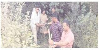
అడవిలో ఉచ్చులను స్వాధీనం చేసుకుంటున్న అటవీ అధికారులు

మహానంది, మేజర్ న్యూస్ : మహానంది సమీపంలోని వ్యవసాయ కళాశాల వద్దనున్న కాశిరెడ్డినాయన ఆశ్రమం వద్ద వన్యప్రాణుల వేట కోసం ఏర్పాటు చేసిన ఉచ్చులను అటవీ అధికారులు స్వాధీనం చేసుకున్నారు. పత్రికల్లో వచ్చిన కథనాలకు స్పందించిన అధికారులు శనివారం డిఆర్డీ హైమావతి అధ్యక్షులలో అటవీ