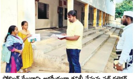
పోలింగ్ కేంద్రాన్ని ఆకస్మికంగా తనిఖీ చేస్తున్న సబ్ కలెక్టర్

కళాశాలలోని 233 నుండి 241వరకు, ఎస్సీ హాస్టల్లోని 251 నుండి 254వరకు పోలింగ్ కేంద్రాలను, మదిరె గ్రామంలో 23 నుండి 27 పోలింగ్ కేంద్రాల్లో నిర్వహిస్తున్న ప్రత్యేక ఓటరు నమోదు కార్యక్రమాన్ని ఆకస్మికంగా సబ్ కలెక్టర్ తనిఖీ చేశారు. ఈ సందర్భంగా సబ్ కలెక్టర్ మాట్లాడుతూ, స్పెషల్ సమ్మర్ రివిజన్ 2025లో భాగంగా నవంబర్ 9, 10వ తేదీల్లో ప్రత్యేక ఓటరు నమోదు కార్యక్రమం ప్రతి ఒక్క పోలింగ్ కేంద్రాల్లో బిఎల్ ఓ అధ్యక్షులతో జనవరి 1 నుండి 18వ తేదీ వరకు వచ్చిన ప్రతి ఒక్కరూ నమోదుగా దరఖాస్తు చేసుకోవాలన్నారు.