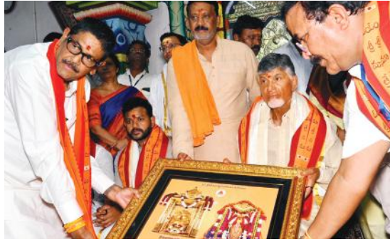
సీఎంకు స్వామి అమ్మవార్ల చిత్రపటాన్ని అందజేస్తున్న దృశ్యం