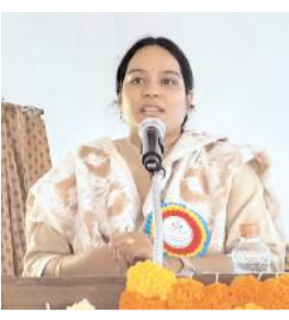
కర్నూలు స్పోర్ట్స్, మేజర్ న్యూస్: కర్నూలు నగరంలోని

- ఘనంగా ఉర్దూ యూనివర్సిటీ వ్యవస్థాపక దినోత్సవం