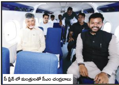
సీ ఫ్లైన్ లో మంత్రులతో సీఎం చంద్రబాబు