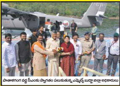
పాతాళగంగ వద్ద సీఎంక స్వాగతం పలుకుతున్న ఎమ్మెల్యే బుద్ధా జిల్లా అధికారులు