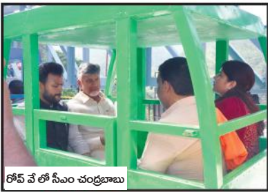
రోప్ వే లో సీఎం చంద్రబాబు