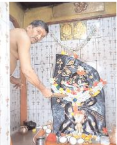
స్వామి వారికి పూజలు చేస్తున్న అర్చకుడు