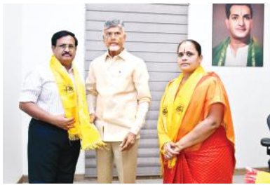
కప్పట్రాళ్ల దంపతులకు పనులు కండువా కప్పట్రాళ్ల చంద్రబాబు