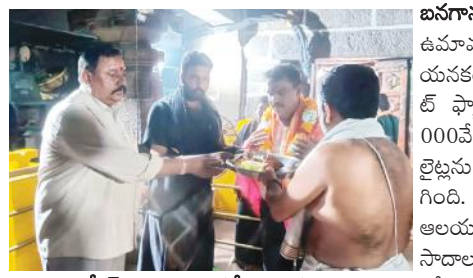
స్ట్రీట్ లైట్లను అందజేస్తున్న దృశ్యం