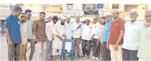
ముఖ్యమంత్రి చంద్రబాబునాయుడు చిత్రపటానికి పాలాభిషేకం చేస్తున్న ముస్లింలు