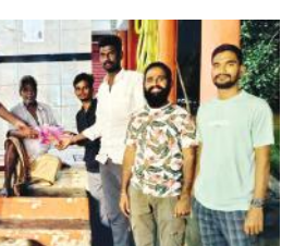
దుప్పట్లు అందిస్తున్న యూత్ సభ్యులు

ఎమ్మిగనూరు టౌన్, మేజర్ న్యూస్ : ఎమ్మిగనూరు శ్రీ మార్కెండ్యు స్వామి యూత్ ఆధ్వర్యంలో పట్టణంలోని రోడ్డుపై ఉన్న నిరాశ్రయులకు, వృద్ధులకు, పేదలకు దుప్పట్లు యూత్ సభ్యులు అందించారు. ఈ సందర్భంగా యూత్ సభ్యులు మాట్లాడుతూశ్రీమార్కెండ్యు యూత్ ఆధ్వర్యంలో పలు సేవ కార్యక్రమాలుకొనసాగిస్తున్నామని, ఇందులో భాగంగా చలికాలం ప్రారంభం అవుతున్న సందర్భంగా పేదలకు, వృద్ధులకు దుప్పట్లు అందిస్తున్నట్లు తెలిపారు. ఇలాంటి సేవా కార్యక్రమాలు మార్కెండ్యు యూత్ ఆధ్వర్యంలో మరెన్నో చూస్తూనే ఉంటామని తెలిపారు.