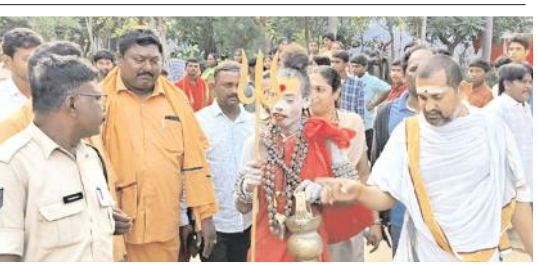
అఘోరికి స్వాగతం పలుకుతున్న అధికారులు

మహానంది, మేజర్ న్యూస్ : ప్రముఖ పుణ్యక్షేత్రమైన మహానందిలో అఘోరి పూజలు నిర్వహించారు. శనివారం క్షేత్రానికి వచ్చిన ఆమెకు ఆలయ మర్యాదలతో వేద పండితులు, అధికారులు స్వాగతం పలికారు. అనంతరం ఆమె శ్రీ కామేశ్వరి సమేత మహానందిశ్వర స్వామి వార్లకు ప్రత్యేక పూజలు నిర్వహించారు. వేద పండితులు ఆశీర్వాదించి స్వామి వార్ల తీర్థప్రసాదాలు అందజేశారు. అనంతరం ఆమె పాత్రికేయులతో మాట్లాడుతూ సనాతన ధర్మం కోసం, హిందూ పరిరక్షణ కోసం లోక కళ్యాణార్థమై క్షేత్ర సందర్శనలు, పాదయాత్రలు