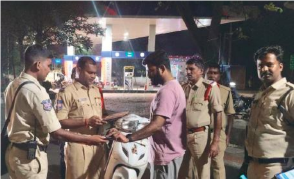
సిద్దిపేట ప్రతినిధి, మేజర్ న్యూస్ : జిల్లా పరిధిలోని రాజీవ్ రహదారిపై శనివారం రోజున సాయంత్రం నుండి రాత్రి వరకు పోలీసులు ప్రత్యేకంగా వాహనాల తనిఖీ నిర్వహించడం జరిగిందని సిపి అనురాధ తెలిపారు. ఈ

- సర్కేజీ వాహనాల తనిఖీలు - రోడ్డు ప్రమాదాల నివారణకు చర్యలు తీసుకోవాలి అక్రమ రవాణా చేయరాదు - డ్రంక్ అండ్ డ్రైవ్/మద్యం సేవించి వాహనాలు నడపరాదు - 53 కేసులు నమోదు చేసిన పోలీసులు