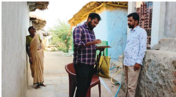
సంబంధించిన అన్ని వివరాలు చెబుతున్నారు నిరుపేద కుటుంబాలకు ఇల్లు లేని వారికి కొత్తగా ఇల్లు గవర్నమెంట్ ఇస్తుందా లేదా అనే అనుమానం లో ప్రజలు ఏమీ తోచని పరిస్థితుల్లో ఉన్నారు ఇప్పటికే సీడ్. గా సాగుతున్న సర్వే కు ప్రజలు తమ వంతు బాధ్యతగా వివరాలు చెప్పి సహకరిస్తున్నారు

కొల్లారం మేజర్ న్యూస్: మెదక్ జిల్లా కొల్లారం మండలం గ్రామాలలో సమగ్ర కుటుంబ సర్వే కొనసాగుతుంది. రాష్ట్రంలో కులాల లెక్క తేల్చుకోవటం కోసం నిర్వహిస్తున్న సమగ్ర కుటుంబ సర్వే పైన ప్రజలలో అనేక అనుమానాలు ఉన్నాయి. ఈ సర్వేలో సేకరిస్తున్న వివరాలతో తమకు ప్రభుత్వం అందించే సంక్షేమ పథకాల గురించి చాలా చోట్ల ప్రజలలో ఆందోళన వ్యక్తం అవుతుంది సర్వే ఇంటికి వచ్చాక తమకు సంబంధించిన వివరాలు ఇంట్లో ఎంతమంది ఉన్నారు ఏం చదువుతున్నారు ఎంత పొలం ఉంది ఇల్లు ఉందా లేదా ఉంటే పెంకుటిల్లా. ఆర్ సి సి బిల్డింగ్ మొబైల్ ఫోన్లు ఎన్ని ఉన్నాయి. బ్యాంకులో ఎంత అప్పు ఉంది. మోటార్ సైకిల్ కార్ ఉందా లేదా అని అడిగి. తెలుసుకుంటున్నారు. అన్ని వివరాలు చెప్పాలా వద్దా అనే అనుమానంలో అటు ఇటుగా ఉన్నారా కాంగ్రెస్ గవర్నమెంట్ వచ్చాక ఇది రెండో సర్వే గా భావించవచ్చు 6 గ్యాలరీలతో అధికారంలోకి వచ్చిన తర్వాత రేవంత్ రెడ్డి హయాంలో తమకు మంచి జరుగుతుందా లేదా అనే అనుమానంలో ఉన్నారా తమకు సంబంధించిన ఆస్తులు అప్పులు