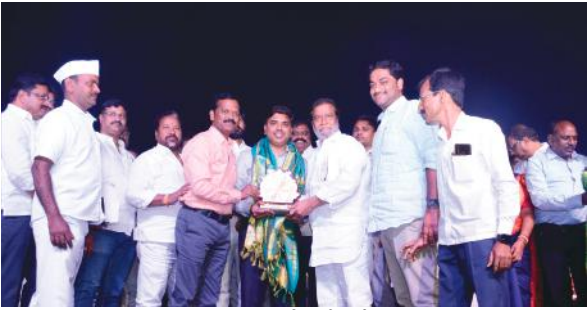
గెలిచిన ఓడిన ఈ ప్రాంతంను పార్టీని వీడలేదు అన్నారు. ఇచ్చిన మాట కట్టుబడి ఉండేది కాంగ్రెస్ పార్టీ తెలంగాణలో అనేక మార్పులు

పాఠశాలలు రెసిడెన్షియల్ పాఠశాలల్లో ప్రహారీ గోడల నిర్మాణానికి అదనపు గదుల నిర్మాణానికి నిధులు మంజూరు చేసినట్లు తెలిపారు. కాంగ్రెస్ ప్రభుత్వం ఏర్పడి ఏదాది కాలం పూర్తికాకముందే ప్రభుత్వంపై బీఆర్ఎస్ కుట్రలు పన్నుతున్నదన్నారు. లంగిచర్ల దాడి సంఘటన ఇందుకు నిదర్శనం అన్నారు. కలెక్టర్ పై దాడి చేసి కుట్రపూరిత రాజకీయాలు చేయడం బి ఆర్ ఎస్ నాయకులకి చెల్లింది అన్నారు. లంగిచర్ల దాడికి సంబంధించి కొంతమంది నాయకులు ఢిల్లీకి పోయారని ఢిల్లీకి పోయి కేసులు మాఫీ కి ప్రయత్నిస్తున్నట్లు తెలిపారు. గుండాయిజాన్ని అబద్ధాలను రౌడీయజాన్ని రూపుమాపాల్సిన అవసరం ఉందన్నారు. త్వరలో తెలంగాణలో అనేక మార్పులు తీసుకురాబోతున్నట్లు మంత్రి దామోదర్ రాజనర్సింహ తెలిపారు. త్వరలో తెలంగాణ రైతులకు రైతు భరోసా ప్రభుత్వం అందించనుంది అన్నారు. కాంగ్రెస్కు జవాబుదారి తన 33 సంవత్సరాల రాజకీయ జీవితంలో