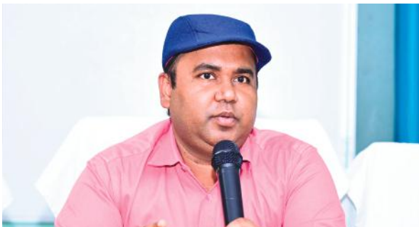
మెదక్ మేజర్ న్యూస్ : ప్రతినీధి...మెదక్ పట్టణంలో ఘనంగా ప్రజా పాలన

విజయోత్సవాలు-2024 నిర్వహిస్తున్నట్లు జిల్లా కలెక్టర్ రాహుల్ రాజ్ తెలిపారు. ప్రజా పాలన విజయోత్సవాలు 2024 సంబంధించి కలెక్టర్ మాట్లాడుతూ ప్రభుత్వ ఆదేశాల మేరకు ప్రజా పాలన విజయోత్సవాలు మెదక్ పట్టణంలో హెచ్ కన్వెన్షన్ ఫంక్షన్ హాల్ నందు రేపు సాయంత్రం 05 గంటలకు. నిర్వహిస్తున్నట్లు తెలిపారు. ప్రభుత్వం ద్వారా 06 గ్యారెంటీల పథకాల అమలు సంబంధించి 80 మంది కళాకారులచే ఆట పాటలు కళా రూపంలో ప్రదర్శనలు ఉంటాయని తెలిపారు. ప్రభుత్వం ఆరు గ్యారెంటీ పథకాల సమగ్ర సమాచారం ముఖ్య అతిథుల ప్రసంగం ఉంటుందన్నారు. స్థానిక మంత్రులు శాసనసభ్యులు, ఇతర ప్రజాప్రతినిధులు ప్రభుత్వ అధికారులు పాల్గొంటారని తెలిపారు. ప్రజా పాలన విజయోత్సవాలకు ప్రజలు అధిక సంఖ్యలో హాజరు కాగలరని ఆయన కోరారు.