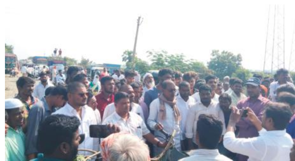
పంపుతామని తెలిపారు మరియు వారం రోజుల్లో రోడ్డు మరమ్మతులు చేయని యెడల మళ్లీ ధర్నా నిర్వహిస్తాం అని స్థానికులు తెలిపారు

రాయికోడ్, సూర్య మేజర్ న్యూస్ రాయికోడ్ మండలంలోని సిరూర్ చౌరస్తా వద్ద రోడ్డు బాగు చేయాలని రోడ్డుపై బైరాయించి రాస్తారోకో నిర్వహించారు అల్లూరుగం మెటల్ కుంట పరిధిలో ఉన్న రోడ్డు బ్రిడ్జి నుండి మైహిబత్ పూర్ గ్రామం వరకు గత రెండు సంవత్సరాలుగా రోడ్డు పనులు చేపట్టడం జరిగింది కానీ రెండు సంవత్సరాలు పూర్తి అయిన రోడ్డు మాత్రం పూర్తి కాలేదు రోడ్డుపై కంకర వేసి సదరు కాంట్రాక్టర్ల వదిలేశారు డాంబర్ వేయకుండానే వదిలేశారు పూర్తి కాకపోవడంతో ఇళ్లల్లో మరియు హోటల్లో పంట పొలాలలో దుమ్ము ధూళి రావడంతో తీవ్ర ఇబ్బందులు ఎదుర్కొంటున్నామని చుట్టూ గ్రామ ప్రజలు ఆదివారం నాడు రోడ్డుపై బైరాయించి రాస్తారోకో నిర్వహించారు జహిరాబాద్ రూలర్ సిబి హనుమంతు సంఘటన స్థలానికి చేరుకుని వారితో మాట్లాడారు ఈ సందర్భంగా పై అధికారులతో మాట్లాడిన సీబి హనుమంతు వారం రోజుల్లో రోడ్డును మరమ్మతులు చేపట్టడానికి పై అధికారులకు నివేదిక