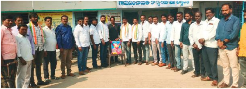
బెజ్జంకి, సూర్యస్వాస్: మండల కేంద్రంలోని అంబేద్కర్ చౌరస్తా వద్ద భారత తొలి మహిళ ప్రధాని శ్రీమతి ఇందిరా గాంధీ జయంతి వేడుకలను కాంగ్రెస్