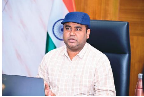
నిర్వహిస్తామని తెలిపారు. ఈ సమావేశంలో జిల్లా కలెక్టర్ మెదక్ జిల్లా సుండి జిల్లా కలెక్టర్ రాహుల్ రాజ్, అదనపు కలెక్టర్ సగీష్ సి.పి.ఓ. బద్రినాథ్, సంబంధిత అధికారులు, తదితరులు పాల్గొన్నారు.

వలసలు మొదలైన వారి వివరాలను జాగ్రత్తగా క్రమబద్ధీకరించుకోవాలని తెలిపారు. కొన్ని వసతి గృహాల్లో, రెసిడెన్షియల్ పాఠశాలలో ఫుడ్ పాయిజన్ కేసులు సమోదవుతున్నాయని, ఈ పాఠశాలలో ఆహారం, పరిశుభ్రత పై ప్రధానంగా ముఖ్యమంత్రి రేవంత్ రెడ్డి, యాపత్ క్యాబినెట్ ప్రత్యేక దృష్టికి సాధించిందని, అధికారులు తగు చర్యలు తీసుకోవాలని ఆదేశించారు. ఫుడ్ పాయిజనింగ్ వంటి సమస్యలు తలెత్తకూడదనే మెస్, కాస్టోటీక్సీ చార్జీలను ప్రభుత్వం పెంచిందని డిప్యూటీ సీఎం తెలిపారు. ఫుడ్ పాయిజన్, అపరిశుభ్రత వంటి అంశాలకు తావు లేకుండా కార్యాచరణ ప్రణాళిక రూపొందించడానికి సంబంధిత అధికారులతో ప్రత్యేక సమావేశం