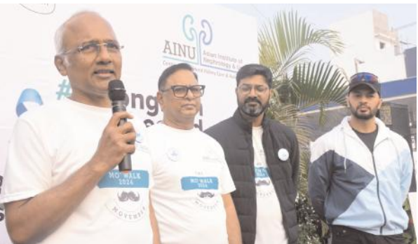
పురుషుల ఆరోగ్య అవగాహన మాసం సందర్భంగా హైల్ వాక్ నిర్వహణ