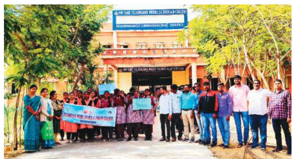
చిన్నకోడూరు, మేజర్ న్యూస్ : భారత రాజ్యాంగం ఆమోదం పొంది 75

సంవత్సరాలు పూర్తయిన సందర్భంగా మండలంలోని ఇబ్రహీంనగర్ తెలంగాణ ఆదర్శ పాఠశాల మరియు కళాశాల విద్యార్థులు ర్యాలీ నిర్వహించారు. భారత దేశంకు 1949 నవంబర్ 26న రాజ్యాంగం ఆమోదించబడి.. కుల,మత,విద్వేషాలకు తావు లేకుండా దేశ ప్రజలందరికీ న్యాయం, స్వేచ్ఛ, సమానత్వం సౌభ్రాతృత్వాలను రాజ్యాంగం కల్పించిన అంశాలపై విద్యార్థులకు అవగాహణ కల్పిస్తూ..చిత్త తేఖనం, వ్యాస రచన, ఉపన్యాస పోటీలను నిర్వహించారు.ఈ కార్యక్రమంలో విద్యార్థులు, ఉపాధ్యాయులు పాల్గొన్నారు.