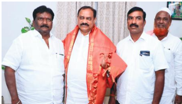
పరిపాలనలో అటు ప్రజలకు,ఇటు ప్రభుత్వానికి ఏమాత్రం హాని కలగకుండా చూసుకోవాల్సిన బాధ్యత కాంగ్రెస్ పార్టీ కార్యకర్తలు,నాయకులపై ఉండన్నారు.