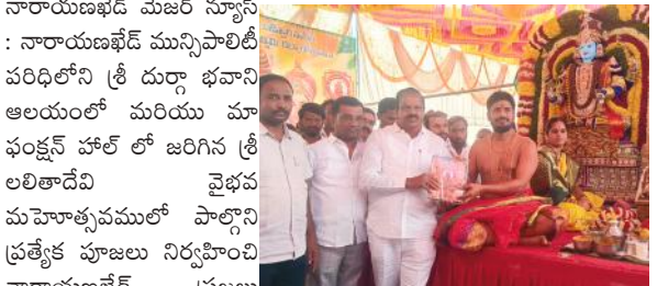
నారాయణఖేడ్ మేజర్ న్యూస్ : నారాయణఖేడ్ మున్సిపాలిటీ పరిధిలోని శ్రీ దుర్గా భవాని ఆలయంలో మరియు మా ఫంక్షన్ హాల్ లో జరిగిన శ్రీ లలితాదేవి వైభవ మహోత్సవములో పాల్గొని ప్రత్యేక పూజలు నిర్వహించి నారాయణఖేడ్ ప్రజలు