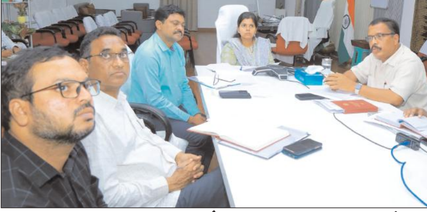
ఉమ్మడి నల్గొండ జిల్లా బ్యూరో

ఈ ఖరీఫ్ ధాన్యం సేకరణలో ఎలాంటి పొరపాట్లకు తావివ్వకుండా సవ్యంగా నిర్వహించాలని రాష్ట్ర పౌరసరఫరాలు, ఇరిగేషన్ శాఖ మంత్రి ఉత్తమ్ కుమార్ రెడ్డి అన్నారు. శనివారం అయిన హైదరాబాద్ నుండి అన్ని జిల్లాల కలెక్టర్లు, పౌరసరఫరాల శాఖ అధికారులతో ఈ వానాకాలం ధాన్యం సేకరణ పై వీడియో కాన్ఫరెన్స్ నిర్వహించారు. ఇప్పటికే కొన్ని జిల్లాలలో పెద్ద మొత్తంలో ధాన్యం వస్తున్నదని,