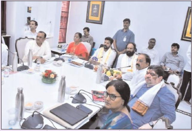
యాదగిరి కొండ, మేజర్ న్యూస్ : యాదగిరిగుట్ట శ్రీ లక్ష్మీనరసింహస్వామి వారిని శుక్రవారం రాష్ట్ర ముఖ్యమంత్రి తరం గౌరవ ముఖ్యమంత్రికి