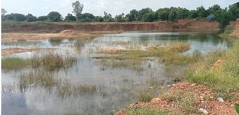
ఆ గుంటలో వర్షాలు పడి చేరువులు తలపిస్తున్నాయని బుచ్చిరెడ్డిపాలెం వాసులు పోసే చెత్త చెదారంతో నిండి మురికి కుపంగా మారిందని కానీ ఇప్పుడు ఆ గుంటలు పట్టించుకునే నాడుడే కరువయ్యారని ఇప్పుడు ఆ ఊసే లేదని ఎన్టీఆర్ కాలనీరామాపురంప్రజలు వాపోతున్నారు.

కొడవలూరు, మేజర్స్ న్యూస్ : కొడవలూరు మండలం గ్రామసత్వం ఎన్టీఆర్ కాలనీనందు గత ప్రభుత్వంలో నాయకులు చేసినటువంటి రాత్రి పగలు తేడా లేకుండా మాపై దాడులు చేసి ఎర్రమట్టిని దొంగిలించుకుపోయిన గ్రావెల్ మాఫియాని కూకటి వేళ్ళతో పేకలిస్తానని ఎలక్షన్లకు ముందు కొంతమంది నాయకులు మీడియా సాక్షిగా గ్రావెల్ మాఫియా అంతు చూస్తామని చెప్పి తర్వాత పట్టించుకోవడంలేదని గతంలో రామాపురం గిరిజనపిల్లలు గుంటలో పడి చనిపోవడం జరిగిందని రెక్క ఆడితే గాని డొక్కా ఆడని పరిస్థితి మాదని ఉదయం లేచి పనికి పోతే సాయం త్రానికి ఇంటికి వస్తామని ఆటలాడుకుంటూ ఆ గుంటల దగ్గరికి వెళ్లినారని ఈ విషయం ప్రశాంత్రెడ్డి దృష్టికి తీసుకుని వెళ్ళగా ఆమె గిరిజనులకు న్యాయం చేస్తామని తెలియజేశారని