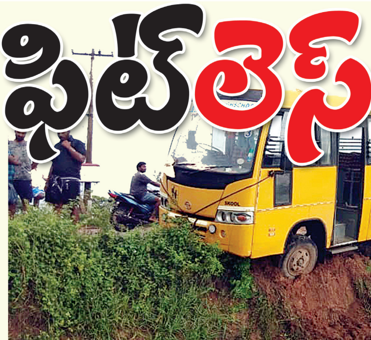
బుధవారం ప్రమాదానికి గురైన అక్షర ప్రైవేట్ స్కూల్ (ఫైల్)

తమ పిల్లలు ఉన్నత భవిష్యత్తు కోసం ప్రతి తల్లిదండ్రులు తమ పిల్లలను ప్రైవేటు పాఠశాలల్లో చేర్చి విద్యను అందిస్తున్నారు. కార్యకర్తల చేసుకుని మరి తమ పిల్లల భవిష్యత్తు బాగుండాలని వేలకు వేలు ఫీజులు చెల్లించి ప్రైవేటు పాఠశాలలో చేర్చిస్తున్నారు. కానీ కేవలం ఫీజులు దండుకునే కొన్ని ప్రైవేటు పాఠశాలల యాజమాన్యం పిల్లలు ఏమైపోతే తమకేంటి ! అనే చందాన తమ వైఖరిని కొనసాగిస్తున్నాయి. ఇందులో భాగంగానే ప్రైవేటు పాఠశాలలకు, కళాశాలలకు ఉన్న బస్సులు, వాహనాలకు ఫిట్టెస్ లేకుండానే నడుపుతున్నారు. ముఖ్యంగా ప్రతి సంవత్సరం ప్రతి ప్రైవేటు పాఠశాల లేదా కళాశాలకు చెందిన వాహనాలకు ఫిట్టెస్ టెస్ట్ చేసి నడపాల్సిన అవసరం ఉంది. కానీ ఈ నిబంధనలు పాటించని పాఠశాల యాజమాన్యం పిల్లల జీవితాలతో చెలగాట మాడుతుంది. ఇందులో భాగంగానే విడవలూరుకు చెందిన అక్షర ప్రైవేటు పాఠశాలకు చెందిన బస్సు అదుపుతప్పి పంట పొలాల్లోకి దూసుకెళ్లింది. అయితే ఆ సమయంలో బస్సులో ఎవరు విద్యార్థులు లేక పోవడంతో పెద్ద ప్రమాదమే తప్పింది.